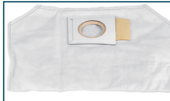
Fleece stofzak ruggedragen stofzuiger (1 stuks) - 197903-8 - 0088381468107