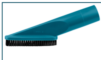
Borstelzuigmond blauw (1 stuks) - 198538-8 - 0088381484381