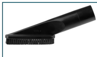
Borstelzuigmond zwart (1 stuks) - 198540-1 - 0088381484404