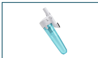
Cycloon voorafscheider wit (1 stuks) - 191D71-3 - 0088381556637