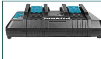
Dubbele snellader DC18RD (1 stuks) - 196933-6 - 0088381444033