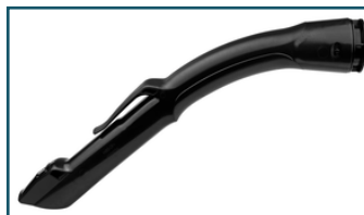
Handgreep zuigbuis kunststof (1 stuks) - 127093-3 - 0088381541619