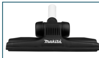
Vloerzuigmond harde vloer& tapijt (1 stuks) - 127082-8 - 3240890497949