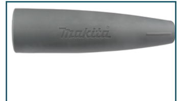
Flexibele zuigmond (1 stuks) - 424841-4 - 3240890497970