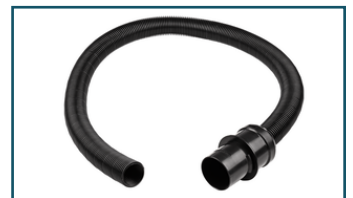
Zuigslang 28x1000mm (1 stuks) - 143787-2 - 0088381485838