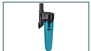
Cycloon voorafscheider zwart (1 stuks) - 191D73-9 - 0088381556644

Dit is slechts een kleine greep uit het ruime assortiment. Kijk voor alle accessoires/verbruiksartikelen in de Catalogus of op www.makita.nl .