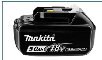
Accu BL1850B LXT 18 V 5,0Ah (2 stuks) - 197280-8 - 0088381459129