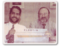
Press conference at the launching of the first Eleotin