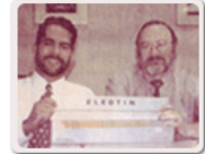
Press conference at the launching of the first Eleotin