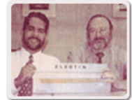
Press conference at the launching of the first Eleotin