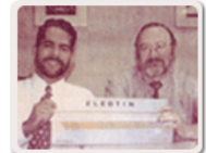
Press conference at the launching of the first Eletin