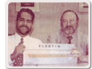
Press conference at the launching of the first Eleotin