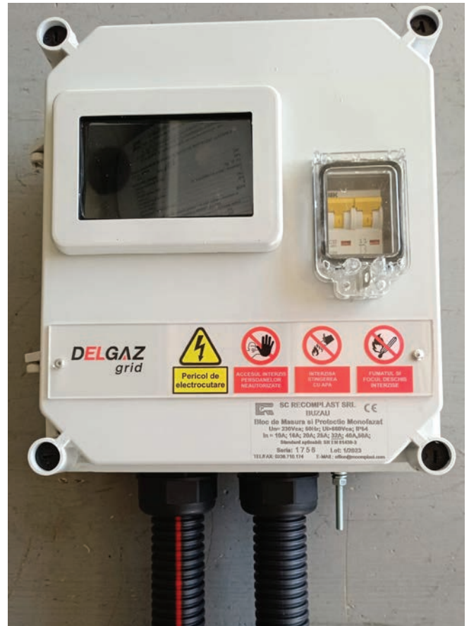
Bloc de măsură racordat cu ajutorul sistemului de protecție EXTRO, format din tuburi cu pereți dubli, tuburi EXTRO Flex cu pereți simpli (fără marcaj roșu) și presetupele adecvate