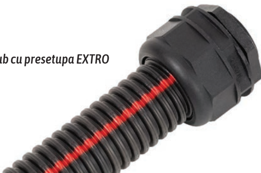
Tub EXTRO Sub cu presetupa EXTRO