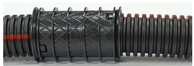
EXTRO Sub cu pereți dubli cuplat cu EXTRO Flex cu pereți simpli