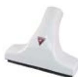
Mundstykke til møbler