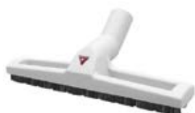
Mundstykke på hjul