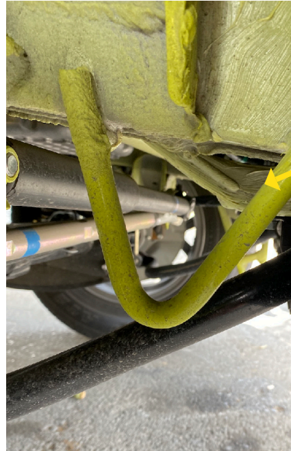
Bracket existente en Suzuki Jimny