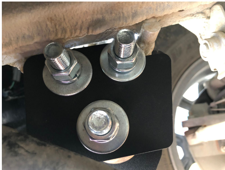
Orden de tornillería: Tornillo - Arandela presión - Arandela plana