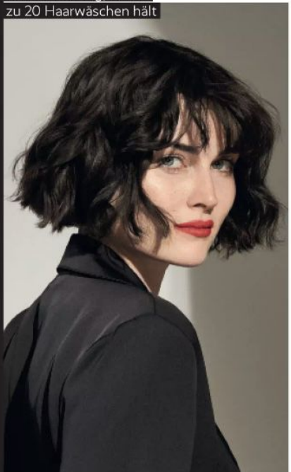
FARBSPIEL „Shinefinity“ ist eine Farbveredelung, die bis zu 20 Haarwäschen hält

Weitere Teilnahmebedingungen und Hinweise zum Datenschutz finden Sie auf Seite 120.