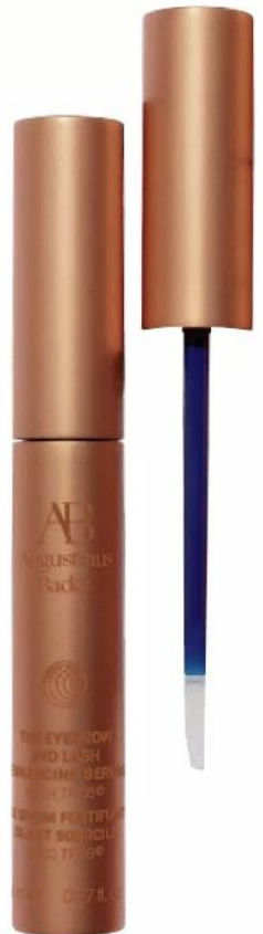
CLEAN BEAUTY „The Eyebrow & Lash Enhancing Serum“ von Augustinus Bader, ca. 135 Euro, augustinusbader.com

Volle Brauen und üppige Wimpern – das wünschen wir uns alle! Wer mit der von der Natur geschenkten Länge und/oder Fülle nicht ganz so happy ist, hilft mit einem wachstumsfördernden Serum nach. Die schnell einziehende, nicht klebrige Textur mit Biotin, roter Winteralge und Färberdistel ist gut verträglich und verspricht erste Ergebnisse nach etwa vier Wochen.