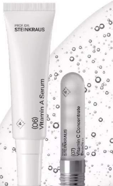
„Vitamin A Serum“ und „Vitamin C Concentrate“ von Dr. Steinkraus, je ca. 98 Euro, steinkraus.com