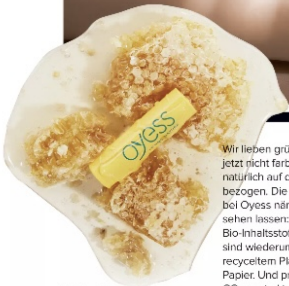
Lipbalm Honey von Oyess, erhältlich in Drogeriemärkten, € 2,99

Hyaluron Drink von Proceanis, erhältlich bei Kussmund Wien, 200 ml (reicht für 20 Tage), € 50