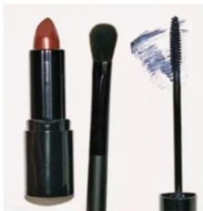
Dunkelblauer Mascara gepaart mit rotem Lippenstift ist ein absoluter Hingucker