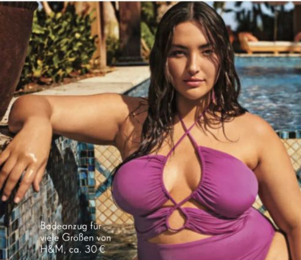
Badeanzug für viele Größen von H&M, ca. 30 €

Nicht ohne meinen SPF SONNENSCHUTZ BEGINNT BEI DEN HAAREN, GEHT WEITER IM GESICHT UND ENDET ERST BEIM KLEINEN ZEH! ALLES EINGECREMT? POOLPARTY, WIR KOMMEN!