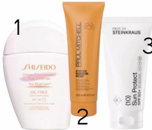
1 Leichte ölfreie Emulsion mit Hyaluronsäure: „Urban Environment Age Defense SPF 30“ von Shiseido, 30 ml, ca. 45 €. 2 Für sonnengeküsstes Haar: „After Sun Nourishing Masque“ von Paul Mitchell, 250 ml, ca. 23 €. 3 Moderne UV-Filter mit Antioxidantien-Plus durch Vitamin E: „Sun Protect SPF 50+“ von Prof. Dr. Steinkraus, 50 ml, ca. 28 €

Nicht ohne meinen SPF SONNENSCHUTZ BEGINNT BEI DEN HAAREN, GEHT WEITER IM GESICHT UND ENDET ERST BEIM KLEINEN ZEH! ALLES EINGECREMT? POOLPARTY, WIR KOMMEN!