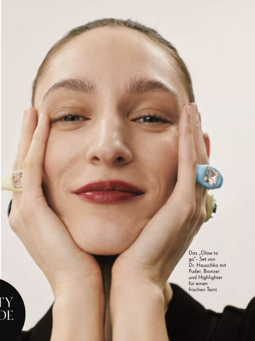
Das „Glow to go“-Set von Dr. Hauschka mit Puder, Bronzer und Highlighter für einen frischen Teint