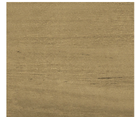
NATURAL TEAK (AT 6 MONTHS)