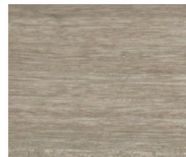
NATURAL TEAK (AT 1 YEAR)