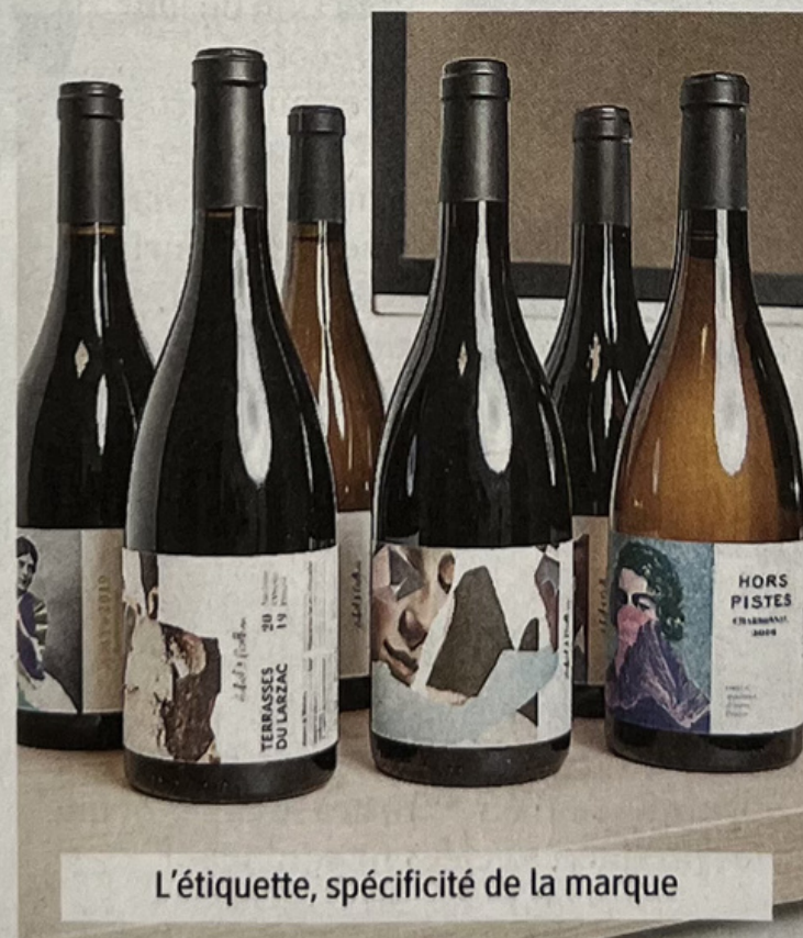
L'étiquette, spécificité de la marque