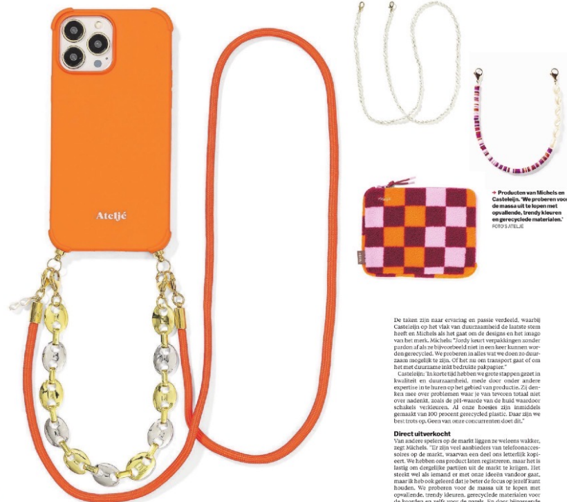
Producten van Michels en Casteleijn. "We proberen voor de massa uit te lopen met opvallende, trendy kleuren en gerecyclede materialen."

Flink gehuld Michels was als een van de eersten in Nederland online actief met een blog. Ze groeide uit tot mediabekendheid als presentator van modeprogramma's, als hoofdredacteur van Indie.nl en als influencer met bijna 100.000 volgers op Instagram. "Dat ik een goet reputeert heb in de media en een actieve community heb opgebouwd op social media, heeft zeker bijgedragen aan het succes van Ateljé. Al had ik geen groot commercieel doel voor ogen. Ik