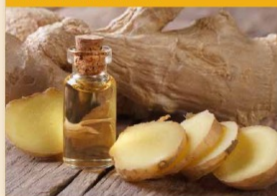
DOELINDA WILLAGER - FOTO'S GETTY IMAGES - BRONNEN: SANTE.NL, MARGARET.NL

Waarschijnlijk weet u wel dat de geur van essentiële oliën impact kan hebben op uw mentale en fysieke gesteldheid. Maar wat niet veel mensen weten, is dat bepaalde essentiële oliën ook geschikt zijn om in te nemen. Zo kunt u twee keer per dag 1 à 2 druppels gemberolie innemen voor meer energie en bevordert een paar druppels citroenolie uw concentratie.