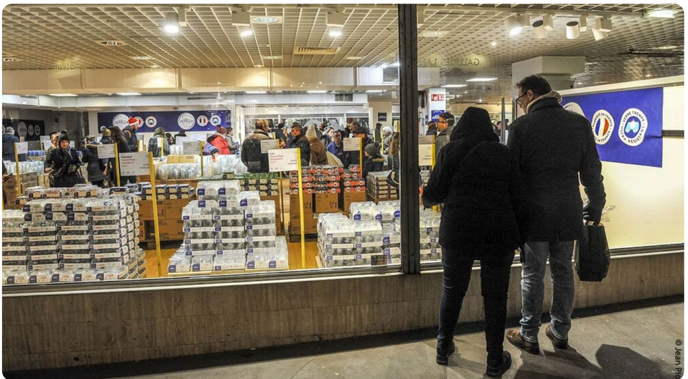
La boutique Durablex au cœur des Halles Châtelet d'Orléans

La Ville d'Orléans et d'Orléans Métropole confirment leur engagement aux côtés de Durablex en lui attribuant un local stratégique dans l'ancien espace des Galeries Lafayette, au cœur des Halles Châtelet.