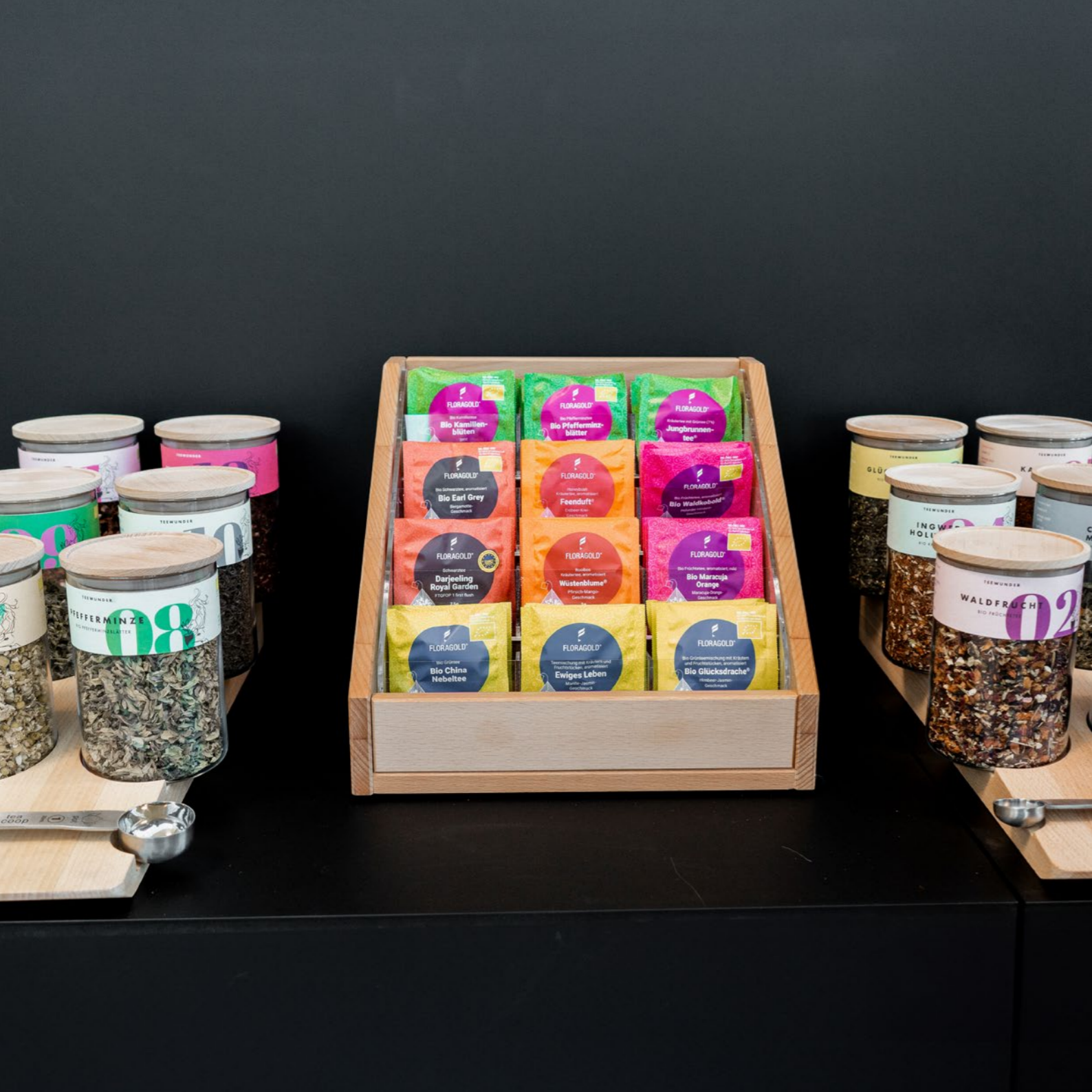
Teedisplay Design by Studio Barbara Gollackner