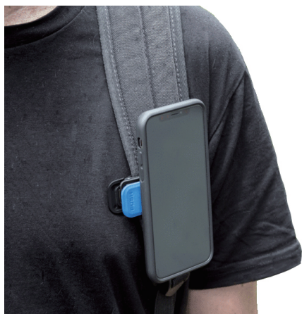
(参考)バックパックの肩ひもへの装着例

2. 45° の角度で上から軽く押しあて、レバーがさがったら、縦または横のお好みの向きにまわすとロックされます。取り外す際には、レバーを押しながら、再度 45° にまわすとスムーズに取ることができます。