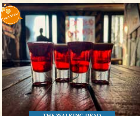
THE WALKING DEAD