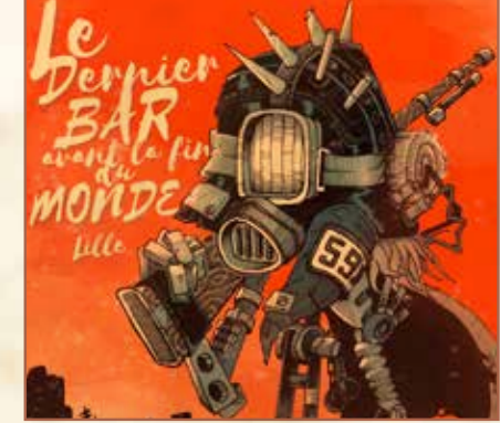
Illustration by Epilost