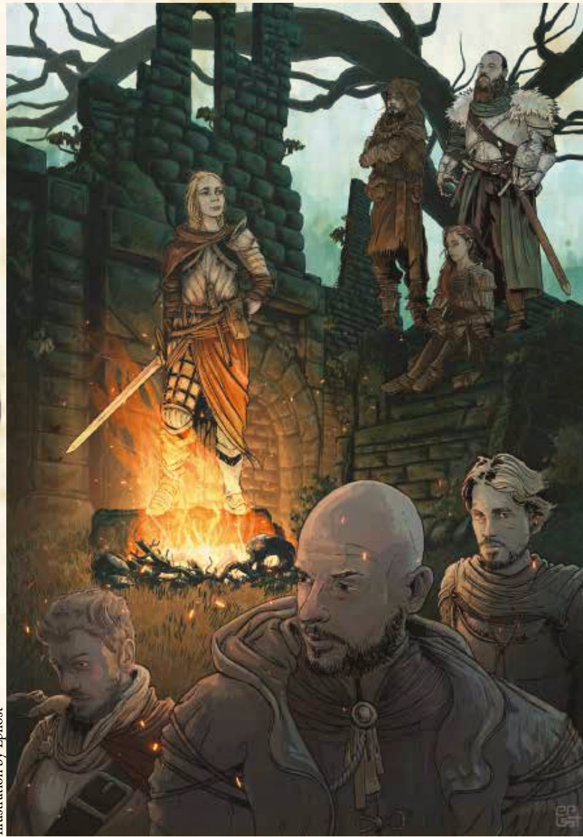
Illustration by Epilost

TYPE: FEU, POINT DE VIE: 2043, NIVEAU: 47, RENAIT DE SES CENDRES. Dernier Bar avant la Fin du Monde - LILLE PRINTEMPS 2024 / ÉDITION DARK FANTASY