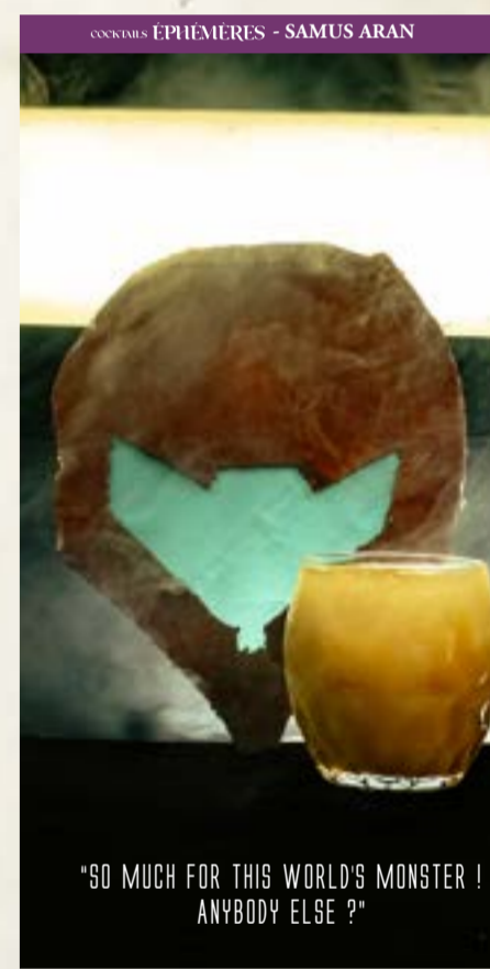
"SO MUCH FOR THIS WORLD'S MONSTER! ANYBODY ELSE ?"