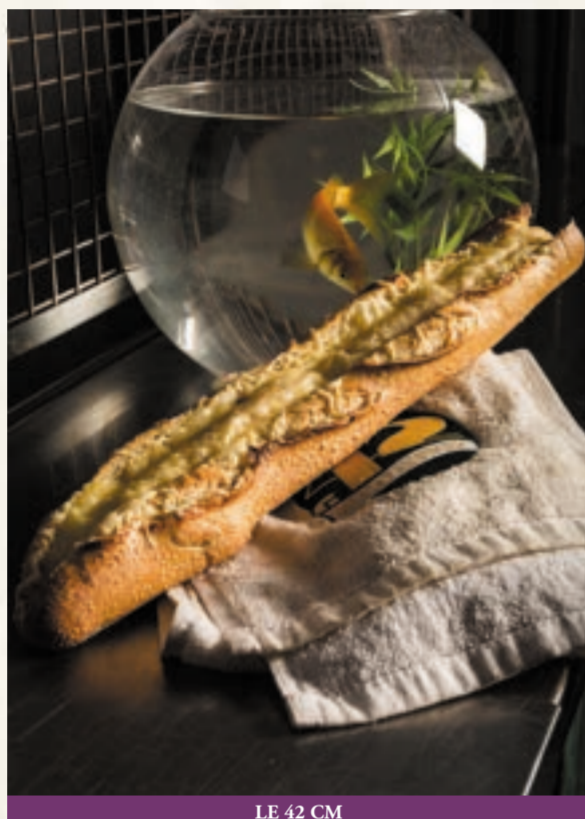
LE 42 CM