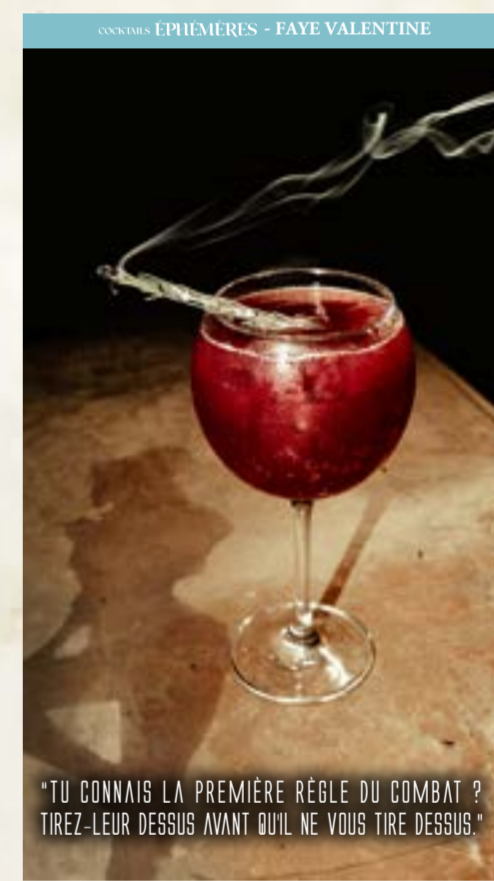
"TU CONNAIS LA PREMIÈRE RÈGLE DU COMBAT ? TIREZ-LEUR DESSUS AVANT QU'IL NE VOUS TIRE DESSUS."

Hypocras 14 cl (frais ou chaud) ..... 6,00 € Gose In The Shell 33 cl ..... 6,00 € Kombucha aux fruits ..... 33 cl 6,50 € Thé glacé maison ..... 4,80 €