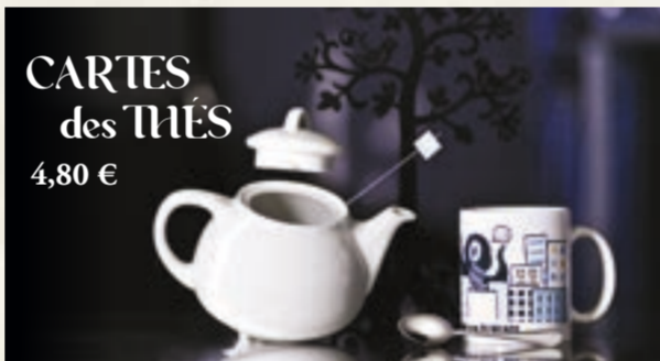
CARTES des MÈS 4,80 €