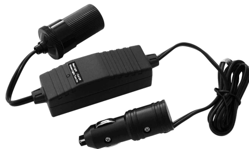
Battery Saver Économiseur de batterie