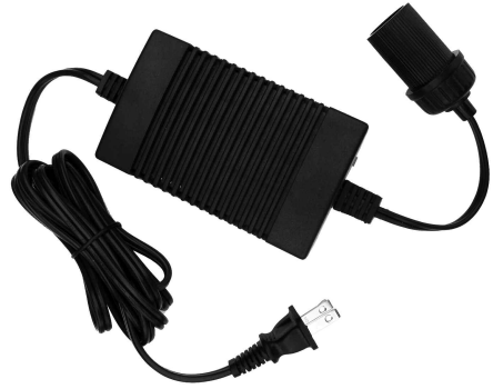
Power Adapter Adaptateur de courant

Pour les prix et disponibilités, veuillez composer le : 800 265-8456