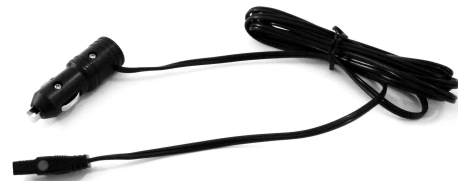
12V Power Cord Cordon d'alimentation 12V