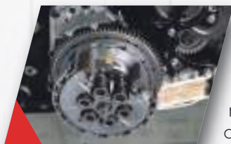
SLIPPER CLUTCH Embrague anti rebote, reduce el torque negativo permitiendo realizar rebajes mas agresivos