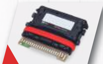
INYECCIÓN BOSCH Made in Germany