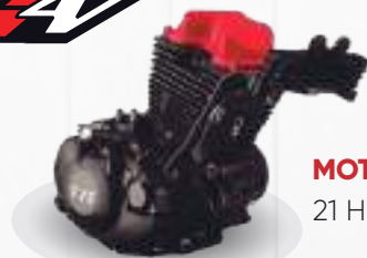
MOTOR RTR 21 HP