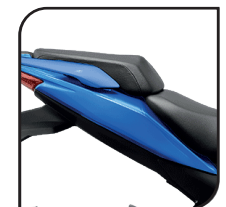
Imagen referencial, no incluye accesorios