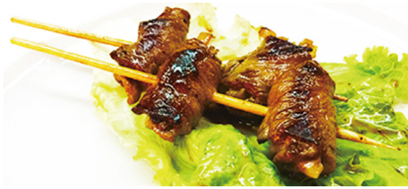
816 TERNERA Beef 🍖