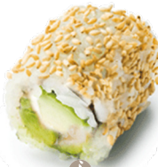
407 PEPINO Y AGUACATE