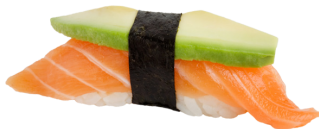
207 SALMÓN & AGUACATE 🐟 Salmon & avocado