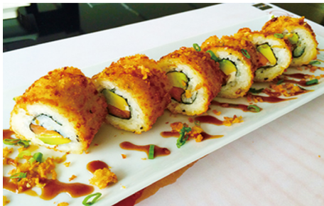
706 CALIFORNIA FRITO CON CEBOLLA FRITA, PUERRO Y SALSA DE TONKASU 6 Piezas 🐟🥑