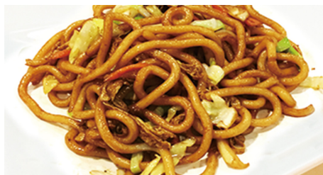
825 UDON Udon 🌾 🥕