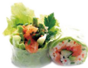
606 SALMÓN Salmon