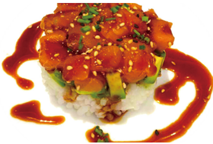
712 TARTA DE SALMÓN PICANTE Salmón Picado Con Aguacate, Arroz Y Salsa De Agripicante 1 Pieza 🐟 🌶️