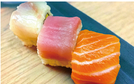
715 ARCO IRIS Rollo De Aguacate Con Salmón, Atún Y Lubina 3 Piezas 🐟