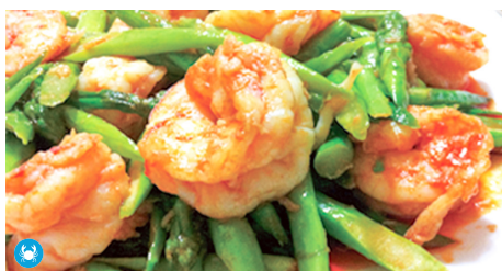
921 GAMBAS CON ESPÁRRAGOS