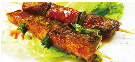
818 TERNERA PICANTE Spicy Beef 🌶️