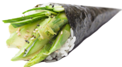
605 VEGETALES 🥒 🥑 Vegetables