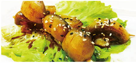
807 CHAMPIÑÓN Mushroom 🍄