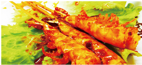
812 GAMBAS PICANTES Spicy Shrimp 🌶️ 🍷