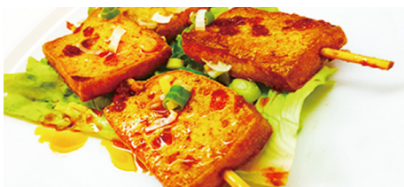
821 TOU-FU PICNATE Spicy Tofu 🌶️ 🍷