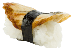
209 ANGUILA 🐟 Eel