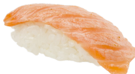
206 SALMÓN TOSTADO 🐟 Roasted salmon