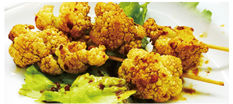
813 COLIFLOR Cauliflower 🌶️