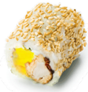
411 PIÑA DE TEMPORADA Pollo Empanadas con Piña