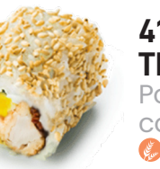
412 MANGO DE TEMPORADA Pollo Empanadas con Mango