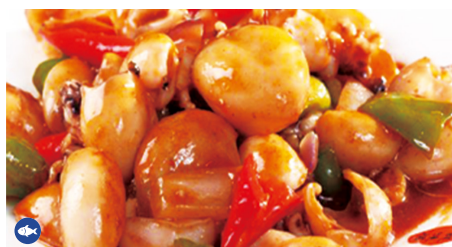
922 CHIPIRONES PICANTE