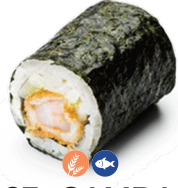
307 GAMBAS EMPANADAS