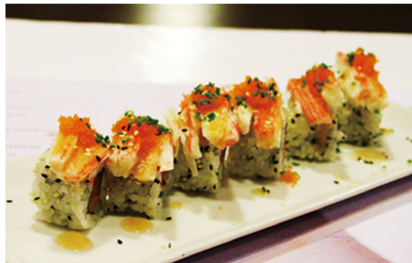
702 CALIFORNIA CON PALITOS DE CANGREJO, HUEVAS DE SALMÓN Y SALSA DE AGRIDULCE 6 piezas 🍣 🍣 🍣