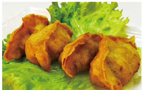
GUIOZAS FRITAS 🍤 Fried Dumplings 4 Piezas