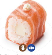
309 CREMA DE QUESO