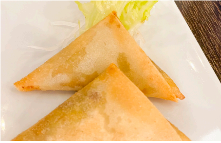
829 EMPANADILLAS CURRY 🌾 Curry samosas 2 Piezas