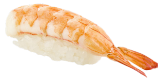
205 EBI 🦐 Prawns