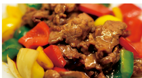
928 TERNERA CON VEGETALES Beef Meat With Vegetables