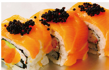
710 CALIFORNIA CON SALMÓN Y HUEVAS NEGRAS 3 Piezas 🐟🥑