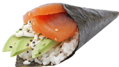
601 SALMÓN 🐟 🥑 Salmon