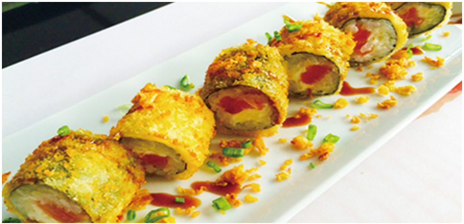
705 MAKI SALMÓN FRITO CON QUESO, CEBOLLA FRITA, PUERRO Y SALSA DE TONKASU 6 Piezas 🐟