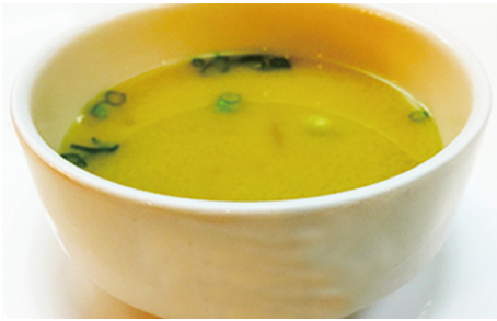
801 SOPA MISO 🌱 Omiso Soup