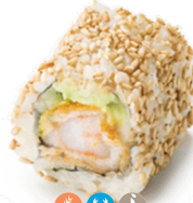
406 GAMBAS EMPANADAS