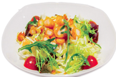
832 ENSALADA CON GAMBAS Shrimps 🍤🌿