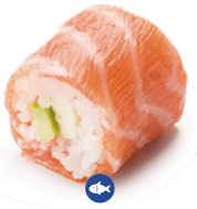
310 SALMON AGUACATE