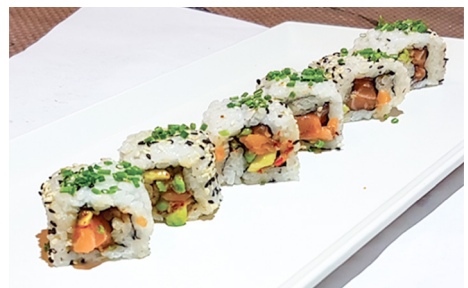
721 ROLLO PICANTE CON SALMÓN, AGUACATE, SALSA DE AGRIPICANTE Y MAYONESA 6 Piezas 🐟🥑🌶️