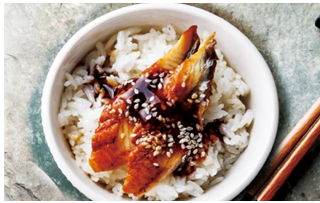
717 ARROZ ANGUILA 1 Pieza 🐟 🍣