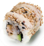
413 SALMÓN TOSTADO Roasted salmon