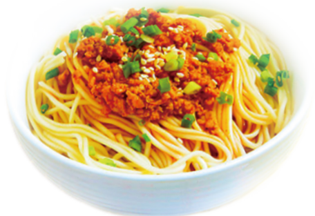
826 DANDAN Spicy Noodles 🌾 🌶️ 🌶️