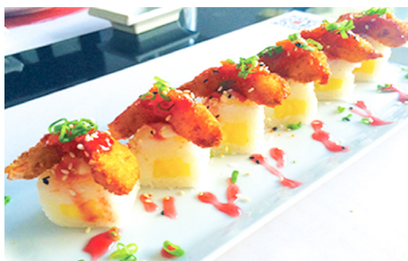
703 ROLLO DE PIÑA CON GAMBAS EMPANADAS, PUERRO Y SALSA DE FRESA 6 piezas 🍣 🍣