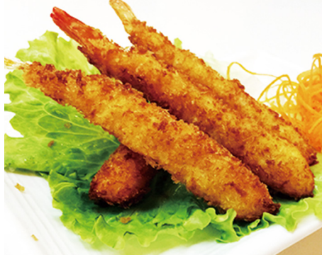
907 GAMBAS EMPANADAS 🍴 Breaded Shrimps