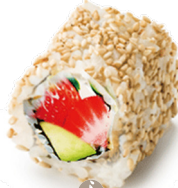
408 FRESA DE TEMPORADA