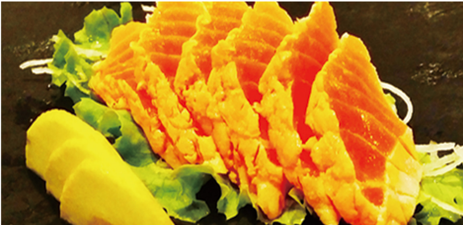
708 SASHIMI SALMÓN TOSTADO 6 Piezas 🐟