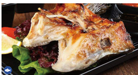
927 CABEZA DE SALMÓN A LA PLANCHA Salmon Head (Limitado Al Stock Existente)