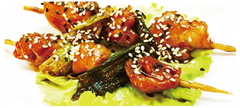
808 POLLO Chicken 🍗