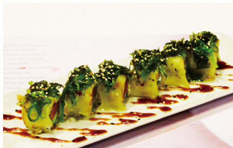
704 CALIFORNIA CON QUESO, ENSALADA DE ALGAS Y SALSA DE TONKASU 6 piezas 🍣 🍣