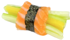
203 SALMÓN PEPINO & NABO AMARILLO 🐟 Cucumber salmon & yellow robbery