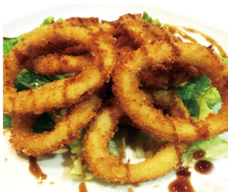
910 ANILLOS DE CALAMAR 🍴 Squid Ring