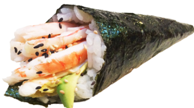
603 GAMBAS 🦐 🥑 Shrimps