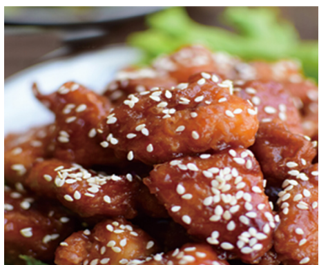
904 POLLO CON SÉSAMO Sesame Chicken 🍴