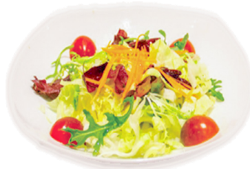
831 ENSALADA Salad 🌿