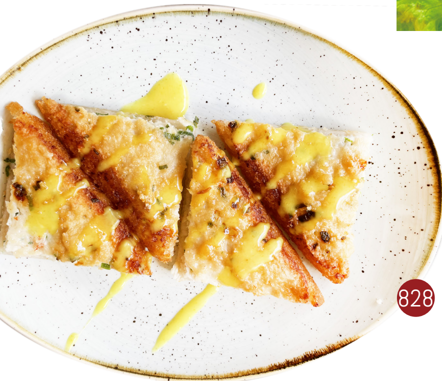
828 PAN RELLENO CON GAMBAS Y POLLO 🍤🐔 Prawn and chicken bread 4 Piezas