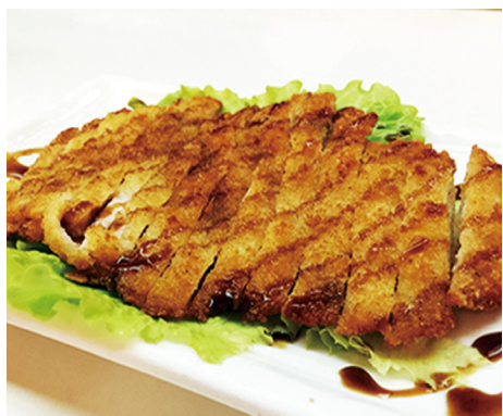
908 POLLO EMPANADAS Breaded Chicken