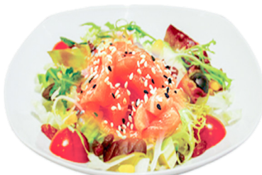
833 ENSALADA CON SALMÓN Salmon 🍣🌿