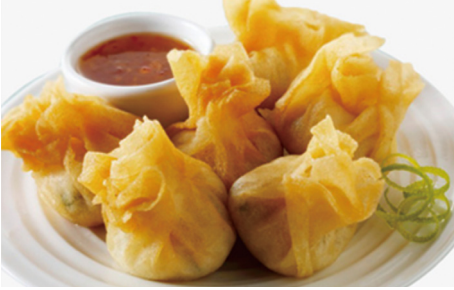
823 WONTON FRITO 🌾 Fried Wonton 4 Piezas