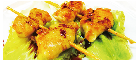
817 POLLO CON QUESO Chicken Cheese