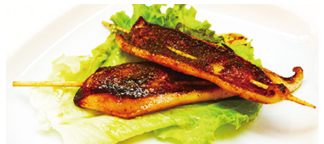
820 CALAMAR Squids 🌶️ 🍷