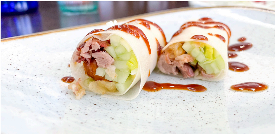
815 PATO CON PEPINO Y PUERRO Duck with cucumber and leek 🍜🥒🌿