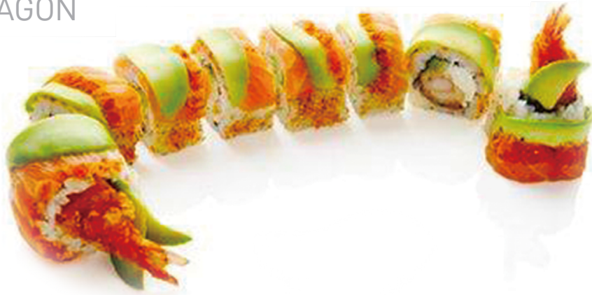
720 ROLLO DE GAMBAS EMPANADAS CON AGUACATE Y SALMÓN 8 piezas 🍣 🍣