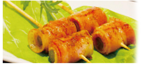
810 BACON CON ESPÁRRAGOS Bacon Asparagus 🍷