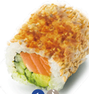
405 CEBOLLA FRITA