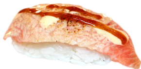
208 QUESO TOSTADO 🧀 🐟 Roasted cheese