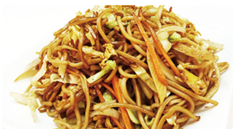
806 TALLARINES Noodles 🌾 🥕