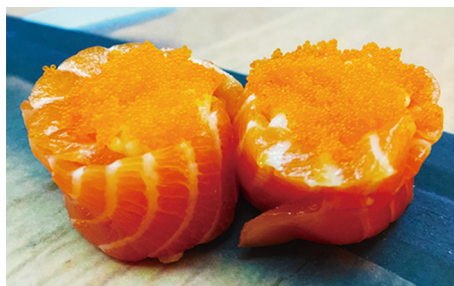
711 SALMÓN CON ARROZ Y HUEVAS DE SALMÓN 2 Piezas 🐟