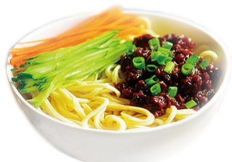
827 ZAJAN Noodles Soybean Paste 🌾