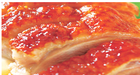
923 PATO FRITO