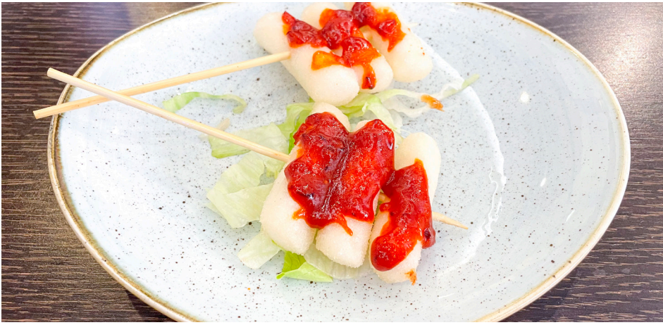
814 PASTA DE ARROZ FRITA CON SALSA PICANTE Fried Pasta with Spicy Sauce 🍜🌶️