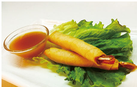
803 CREPES GAMBAS 🌱🍤 Shrimp Spring Rolls 2 Piezas