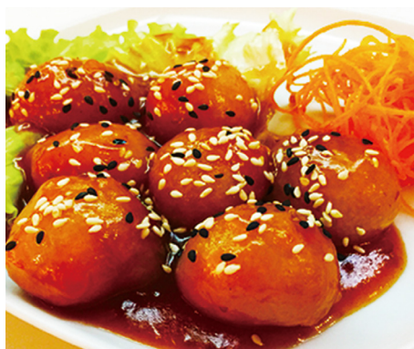
902 POLLO AGRIPICANTE Spicy Chicken 🍴🌶️