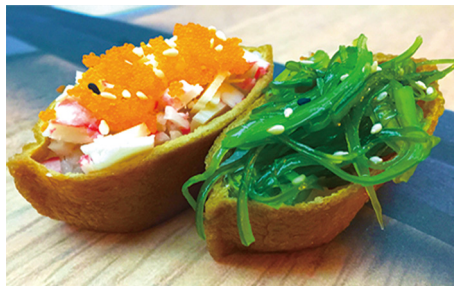
716 TOU-FU CON ARROZ, PALITOS DE CANGREJO Y ENSALADA DE ALGAS 2 Piezas 🐟 🍣