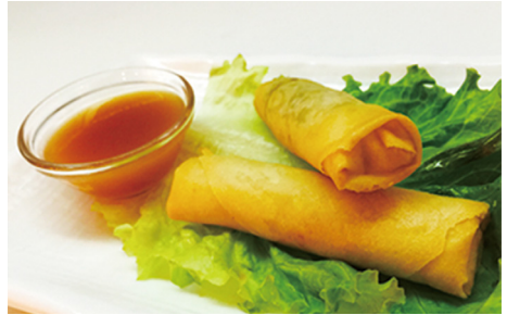
CREPES VEGETALES 🌱 Vegetaian Spring Rolls 2 Piezas