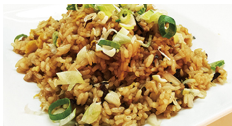
811 ARROZ SALTEADO Fried Rice 🥕 🌾