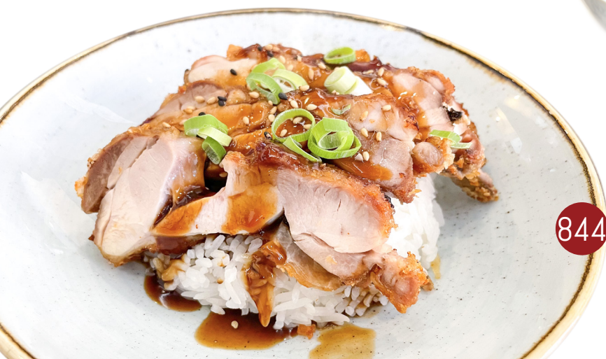
844 ARROZ CON POLLO CRUJIENTE Crispy Chicken Rice 🌾