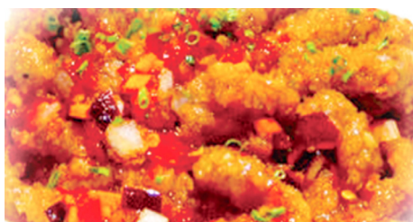
925 TIRAS DE TERNERA PICANTE