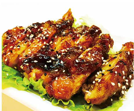
901 POLLO CRUJIENTE Chicken Chop 🍴