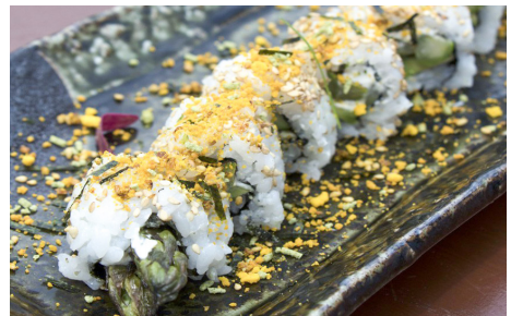
707 ROLLO CON AGUACATE, PEPINO Y ESPÁRRAGO 6 Piezas 🥑