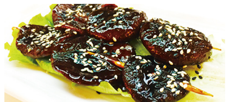
822 SETA PRETA Black Mushroom 🍄