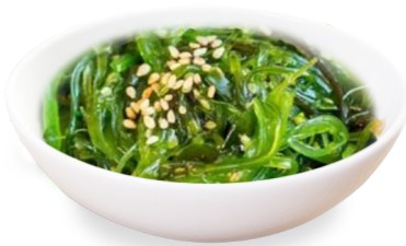
830 ENSALADA DE ALGAS kelp 🌿