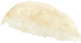
204 PEZ MANTEQUILLA 🐟 Butter fish