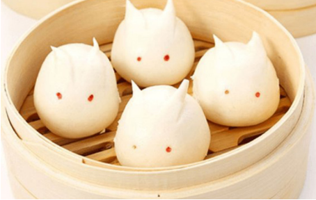
841 PAN ESTILO ASIÁTICO 🌾 Asian Style Bread 2 Piezas