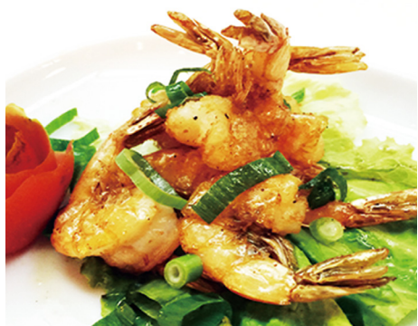
906 GAMBAS CON SAL Y PIMENTA 🍴 Salt and Pepper Shrimp