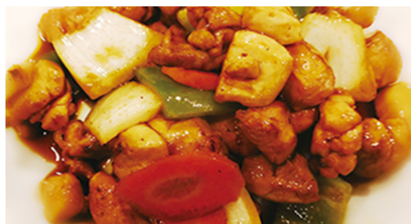
924 POLLO CON VEGETALES