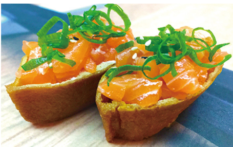
718 TOU-FU CON ARROZ, SALMÓN PICADO Y MAYONESA 2 Piezas 🐟 🍣