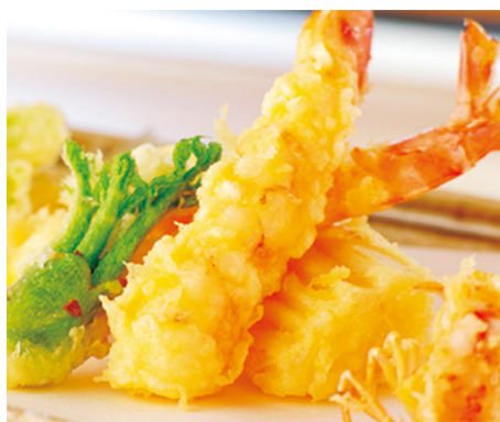
905 TEMPURA Tempura 🍴