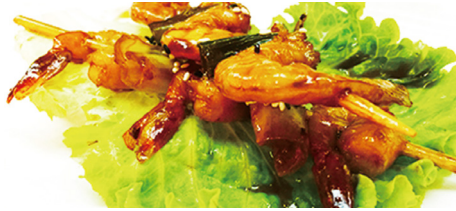
809 GAMBAS Shrimp 🍤 🌶️