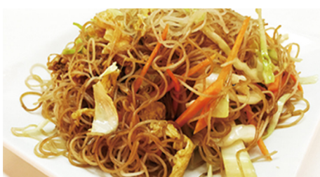
824 FIDEOS FINO Rice Noodles 🌾