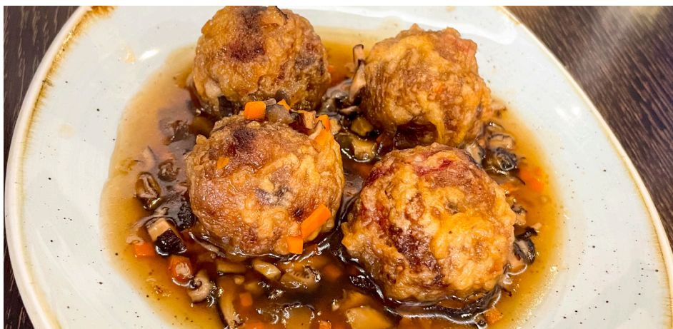
929 ALBÓNDIGAS DE TERNERA PICANTE