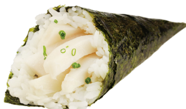
604 PEZ MANTEQUILLA 🐟 🌿 Butter Fish