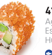
410 AGUACATE Aguacate Espárrago y Pepino Huevas Tópico