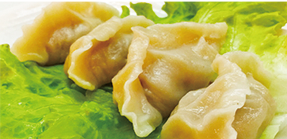
842 GUIOZAS DE POLLO 🌾 Chicken Dumplings 4 Piezas