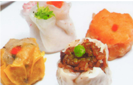
840 BANDEJA AL VAPOR VARIADO 🌾 Steamed Dimsums 4 Piezas