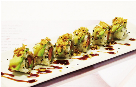
701 CALIFORNIA CON AGUACATE, CEBOLLA FRITA, SÉSAMO Y SALSA DE TONKASU 6 piezas 🍣 🍣