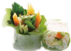
610 COHETE Vegetables