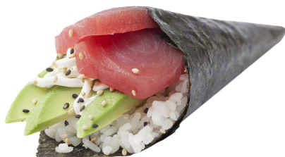
602 ATÚN 🐟 🥑 Tuna