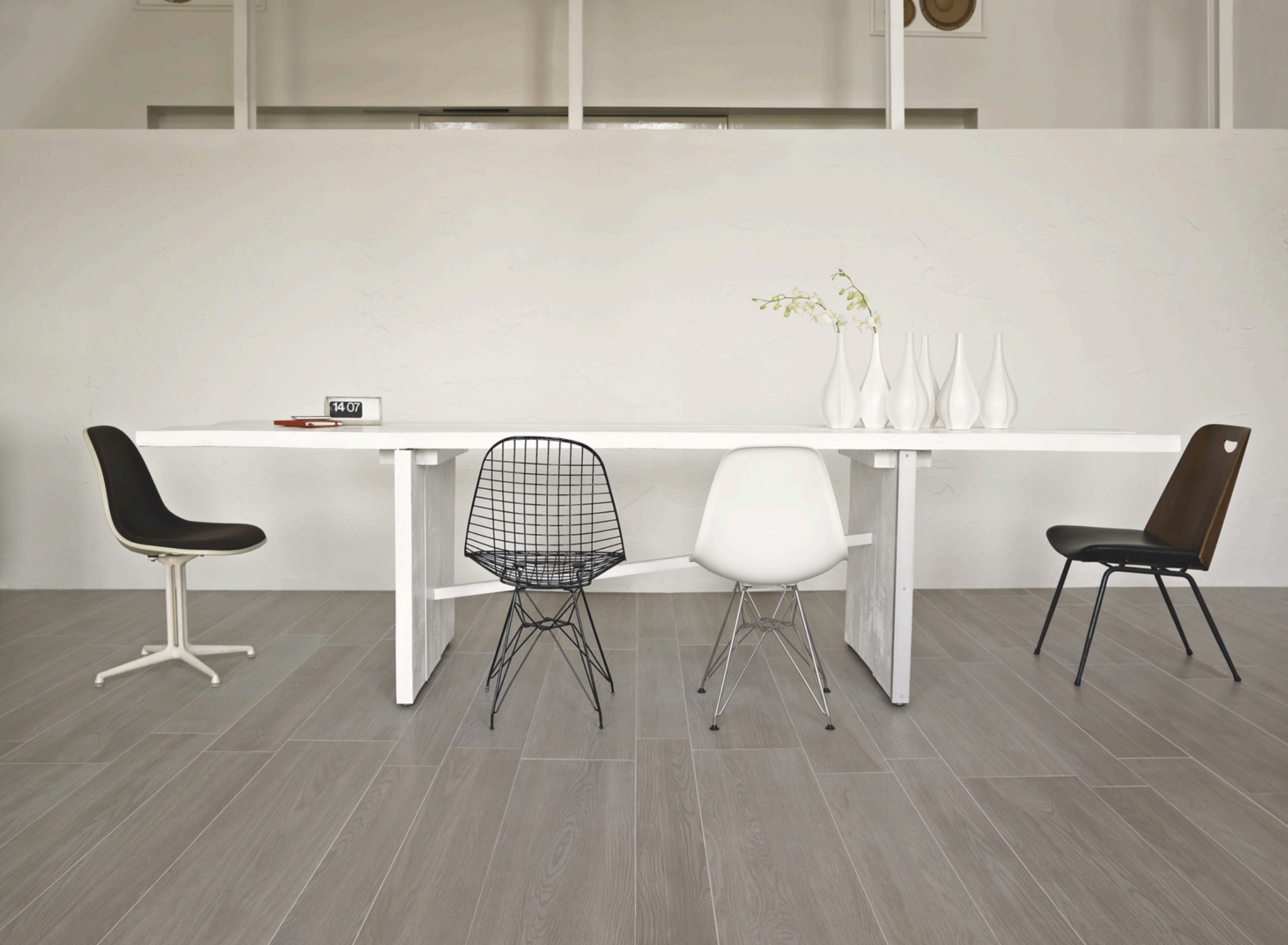
Treverk Capuccino 20 × 120