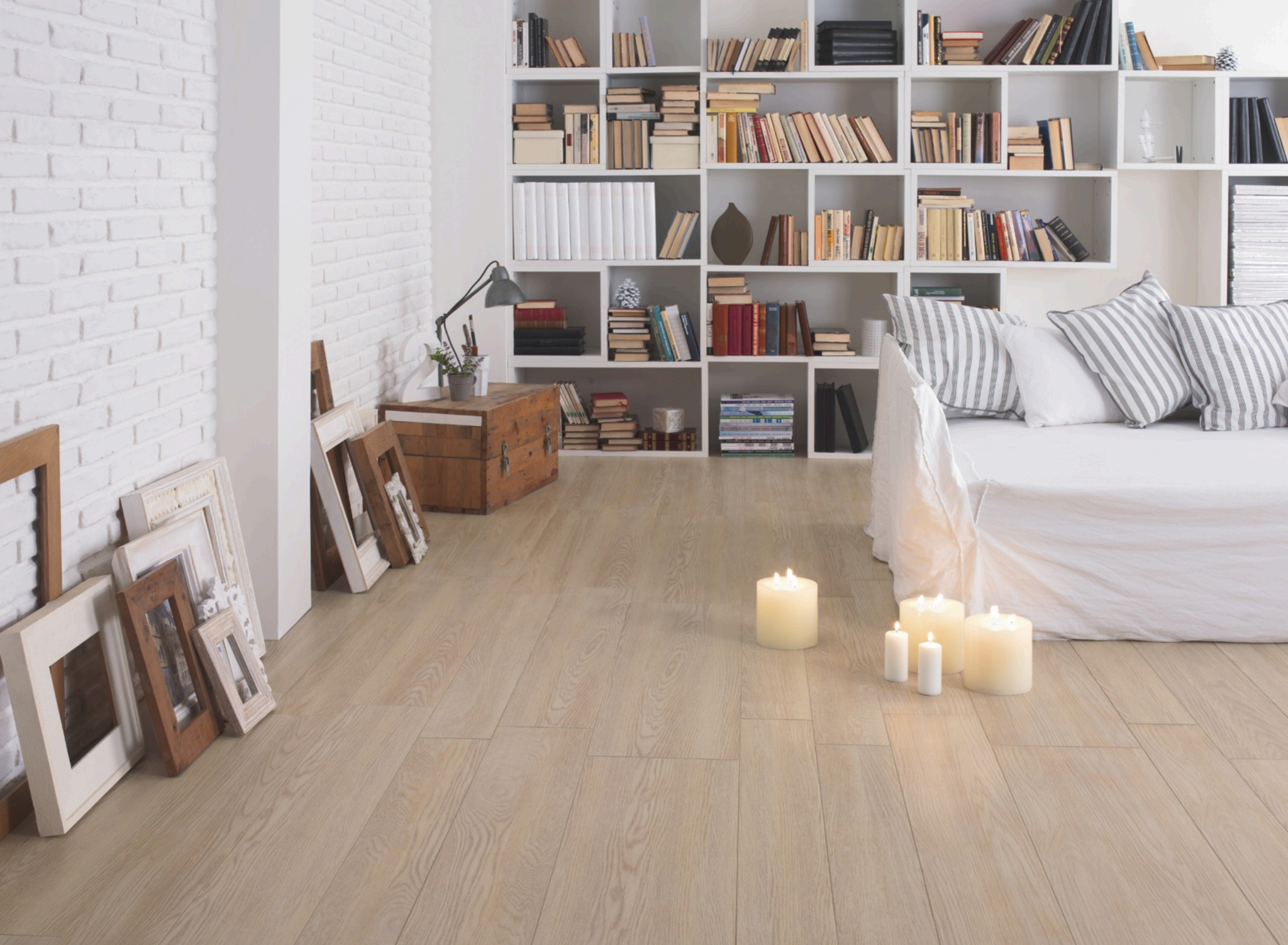
Treverk Beige 20 × 120