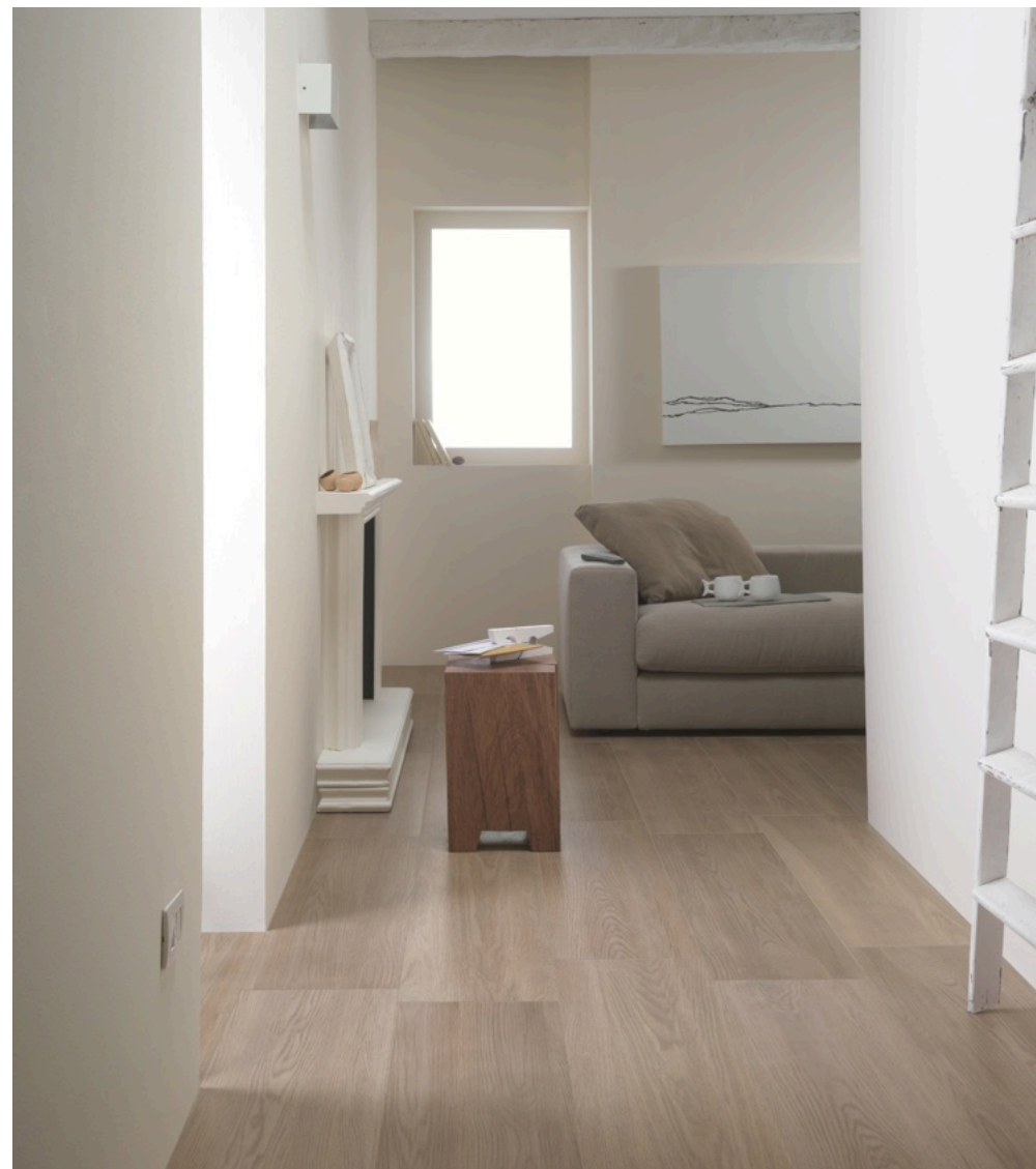
Treverk Teak 20 × 120