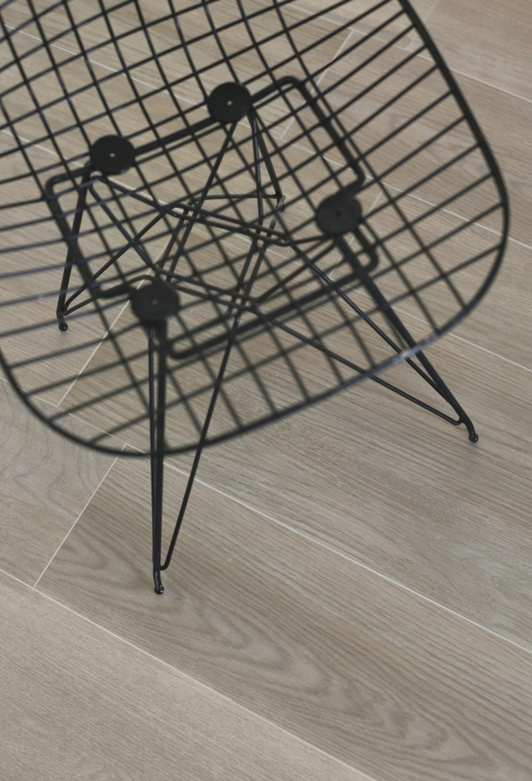
Treverk Capuccino 20 × 120