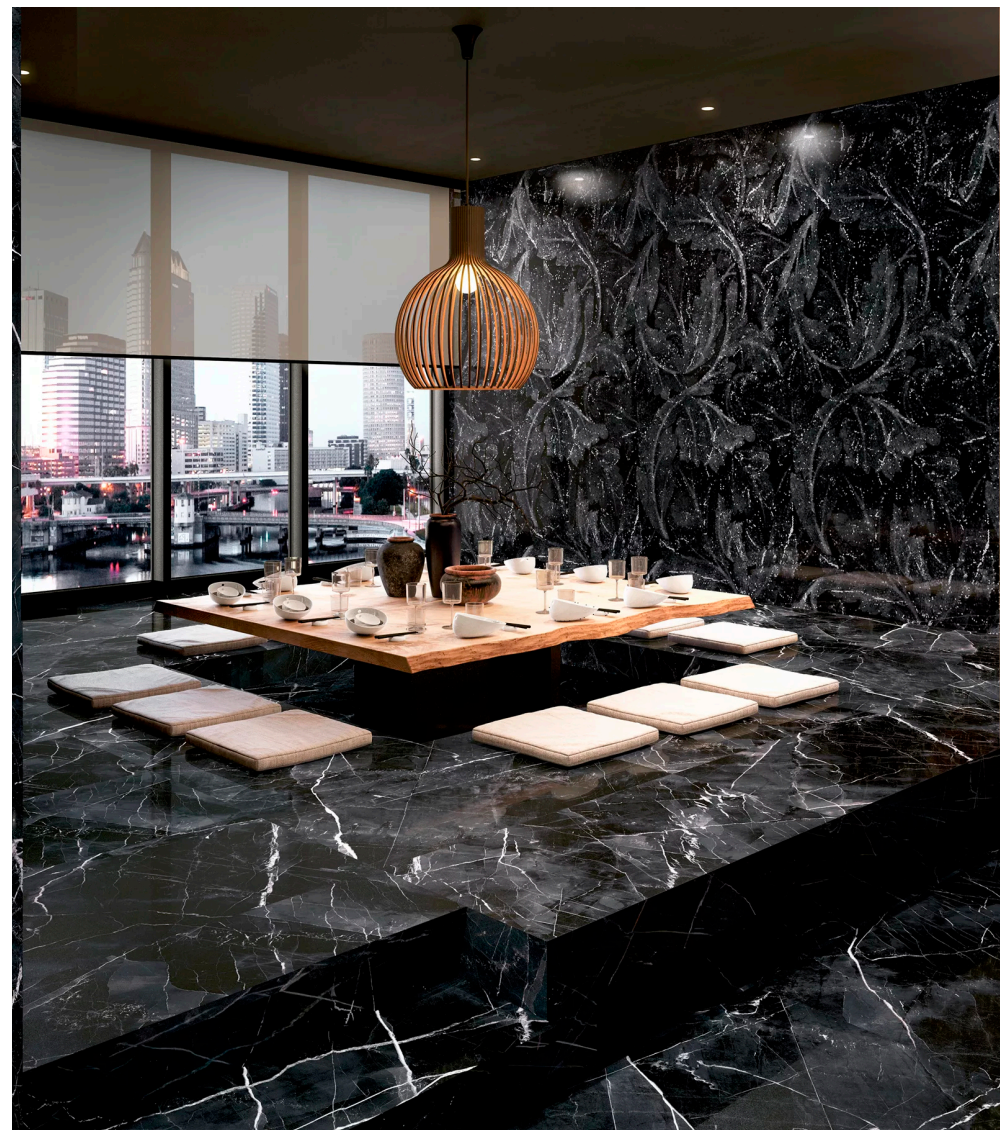
Tele Di Marmo Calacatta Black Full Lappato 90 × 180