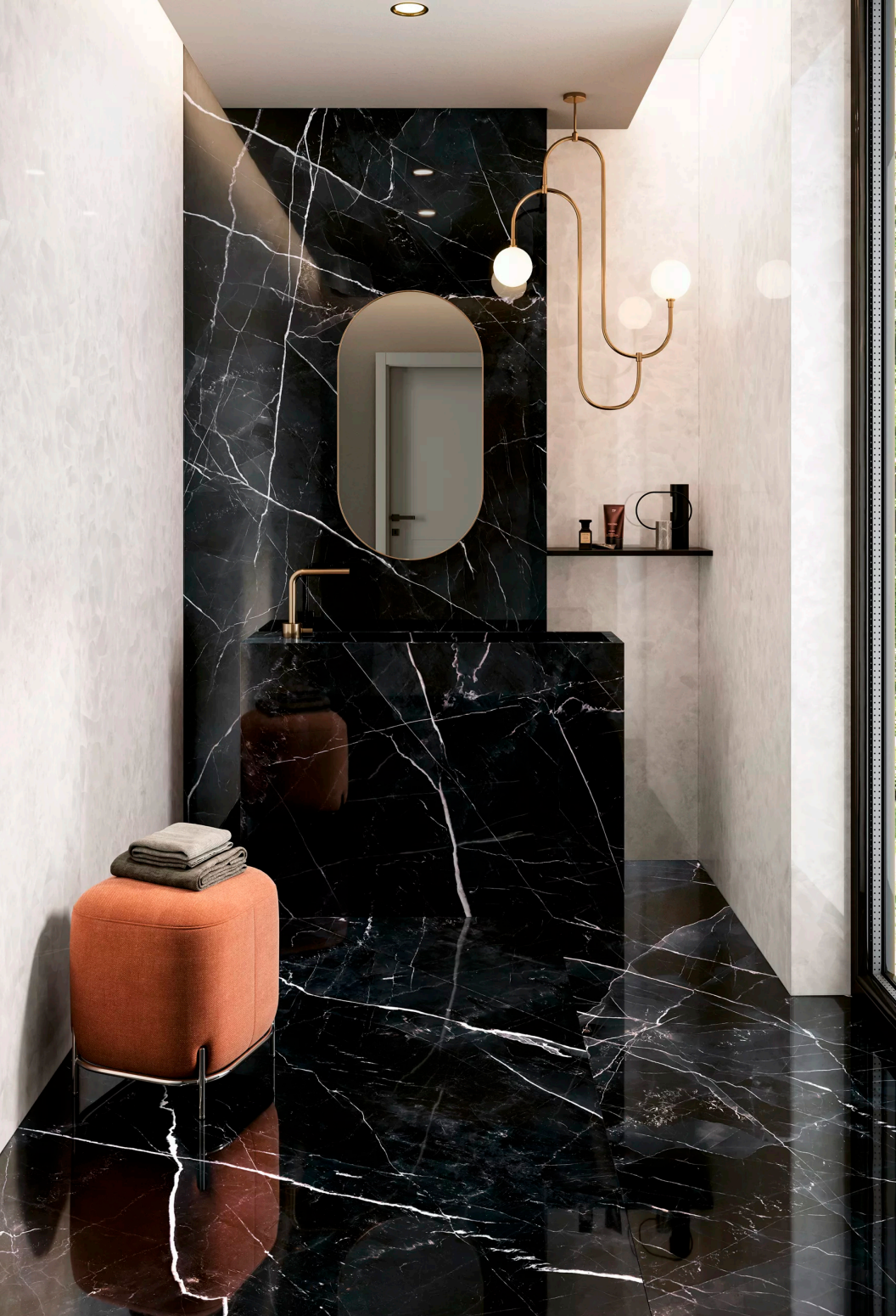
Tele Di Marmo Calacatta Black Full Lappato 90 × 180