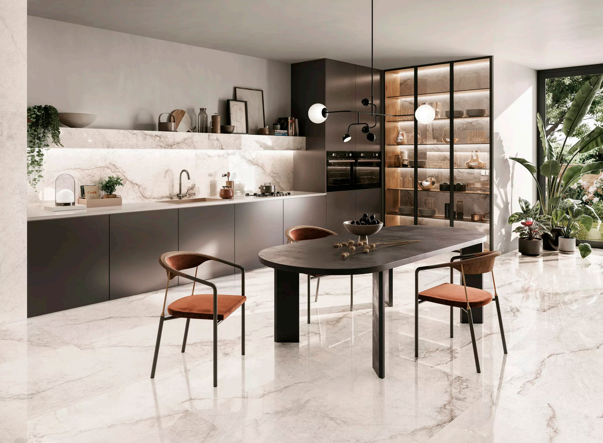
Tele Di Marmo Quarzo Kandinsky Full Lappato 90 × 180