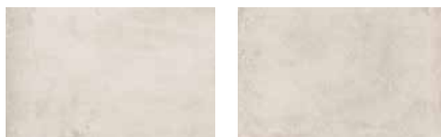
Naturale · Matt