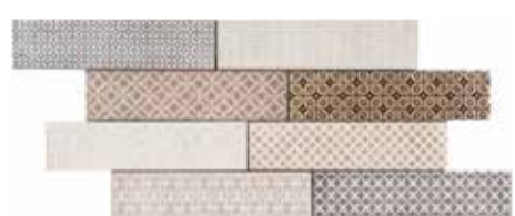
Mosaico (6 Soggetti / 6 Patterns) 30x60 (1)