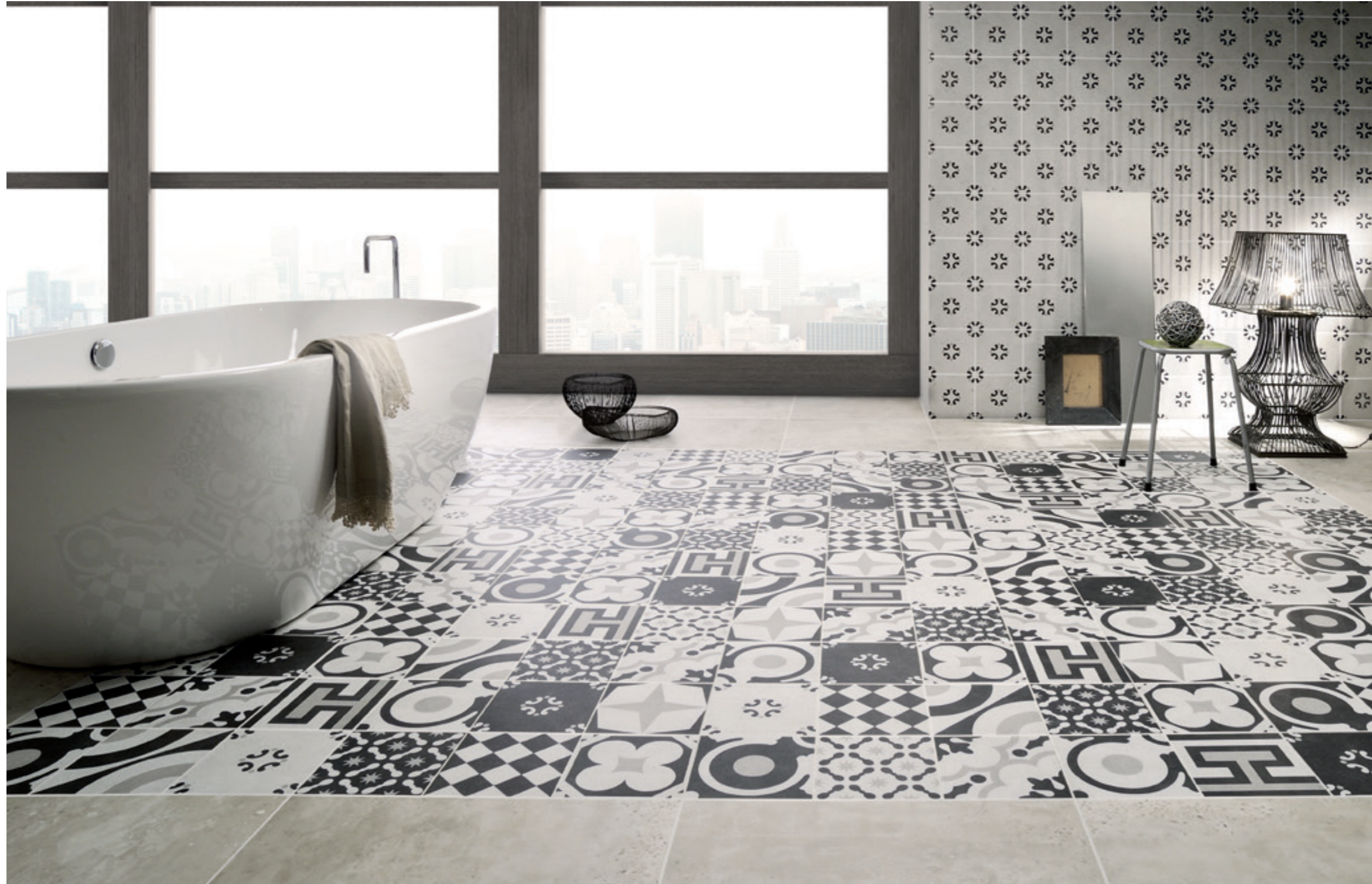
B&W_MIX 20x20 - 8"x8" B&W_3 20x20 - 8"x8" CONCRETE LIGHT GREY 60,4x60,4 - 24"x24" Naturale/Rettificato - Matte/Rectified