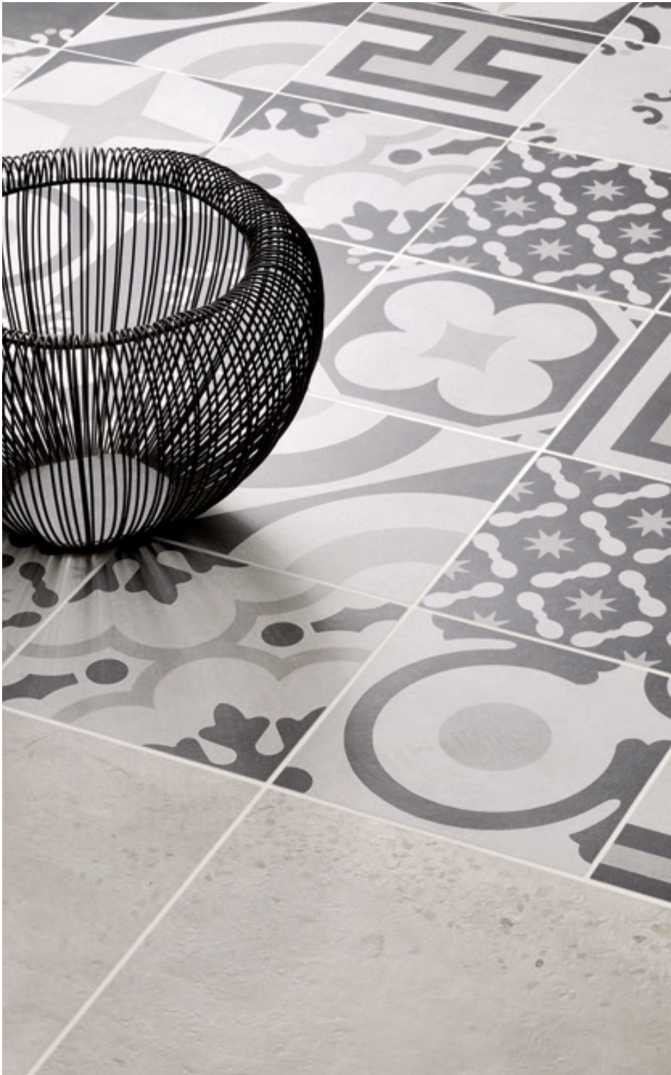
B&W_MIX 20x20 - 8"x8" B&W_3 20x20 - 8"x8" CONCRETE LIGHT GREY 60,4x60,4 - 24"x24" Naturale/Rettificato Matte/Rectified