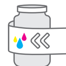
Tiskaj in prilepi