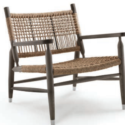
Fauteuil Tessa, FLEXFORM.