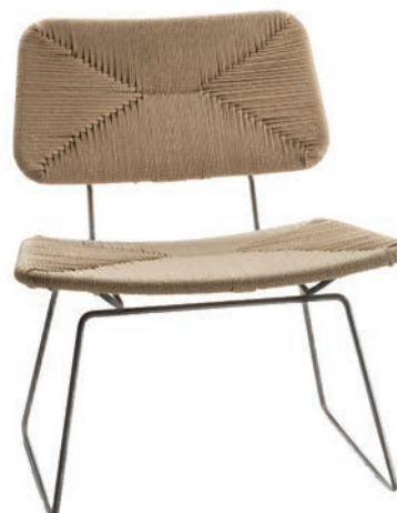
Chaise Echoes, FLEXFORM.