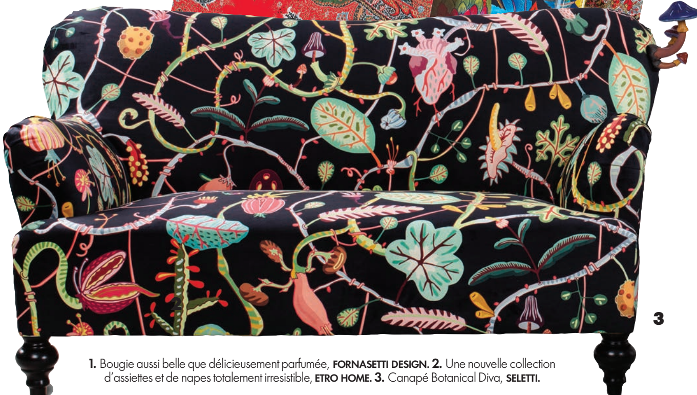
1. Bougie aussi belle que délicieusement parfumée, FORNASETTI DESIGN . 2. Une nouvelle collection d'assiettes et de napes totalement irresistible, ETRO HOME . 3. Canapé Botanical Diva, SELETTI .