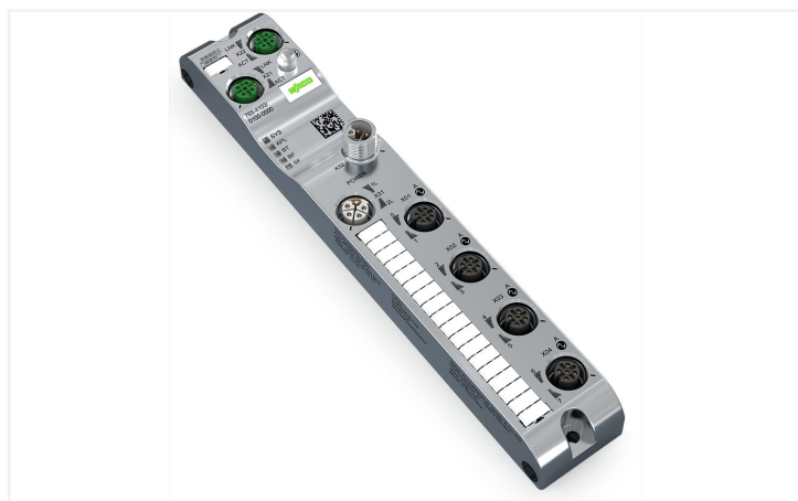
Similar a ilustración