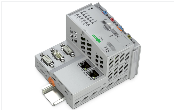
Similar a ilustración