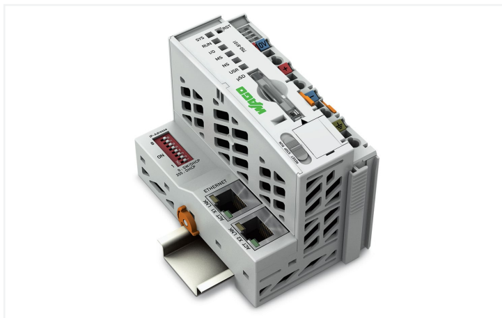
Color: gris claro