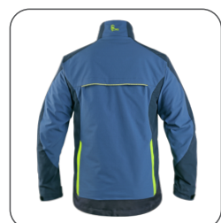
zadní strana - ventilace na zádech back side - ventilation wentylacja z tyłu