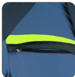
skrytá náprsní kapsa hidden chest pocket przykryta kieszeń na piersi