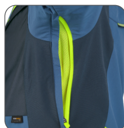
ventilace v podpaží underarm ventilation wentylacja pod pachami