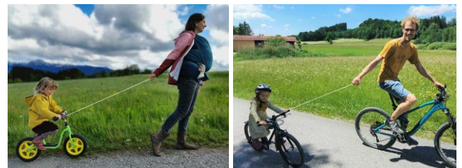
links: zu Fuß / rechts: vom Fahrrad

Zum Ziehen wird das Seil am Griff aus dem Gehäuse gezogen. Nach dem Ziehen sollte es gezielt zurück ins Gehäuse geführt werden. Es sind zwei Betriebsmodi vorgesehen: