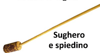
Sughero e spiedino