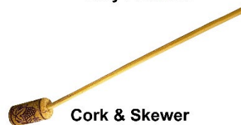
Cork & Skewer