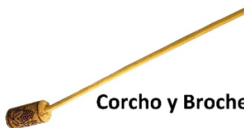
Corcho y Brocheta