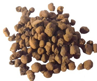
Drenaje de guijarros de arcilla