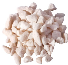
Piedras blancas alpinas