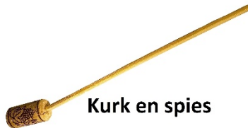
Kurk en spies