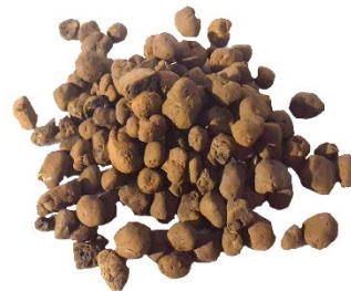
Drainage Clay Pebbles