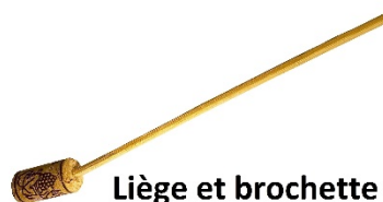
Liège et brochette