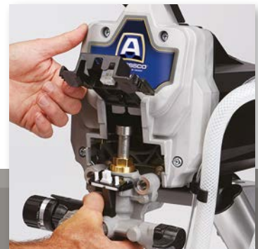
2. EXTRAIGA LA SECCIÓN DE LA BOMBA