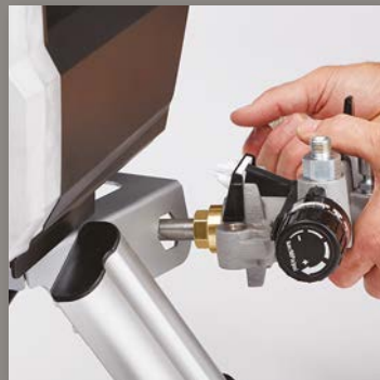
3. UTILICE EL BASTIDOR PARA EXTRAER EL CARTUCHO