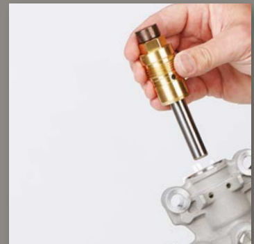
4. INSTALE EL NUEVO CARTUCHO Y SUSTITUYA LA BOMBA