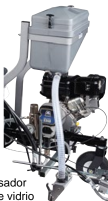
Kit dispensador de esferas de vidrio