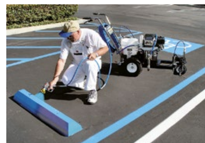
Posibilidad de pintado manual