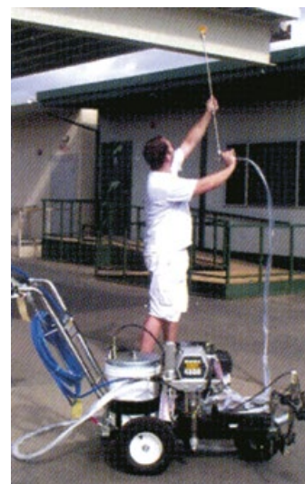
Posibilidad de pintado manual