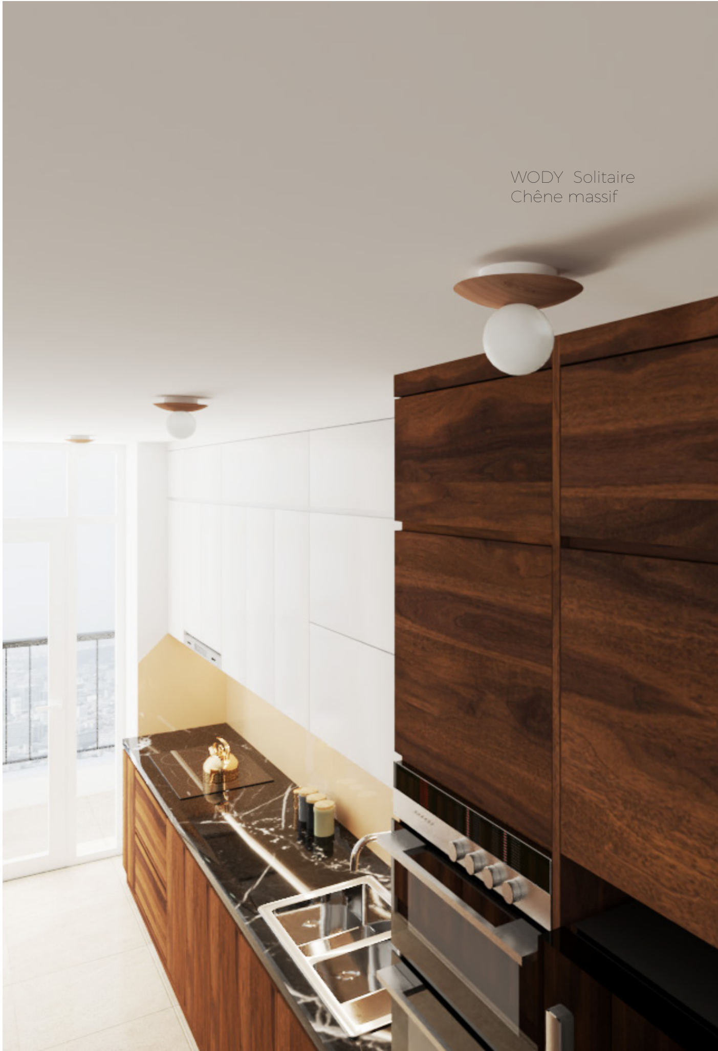
WODY Solitaire Chêne massif