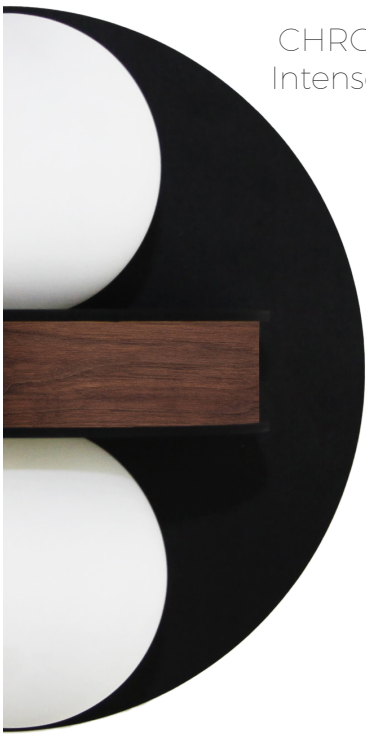
CHROMA Chandelier Intense Black / Noyer