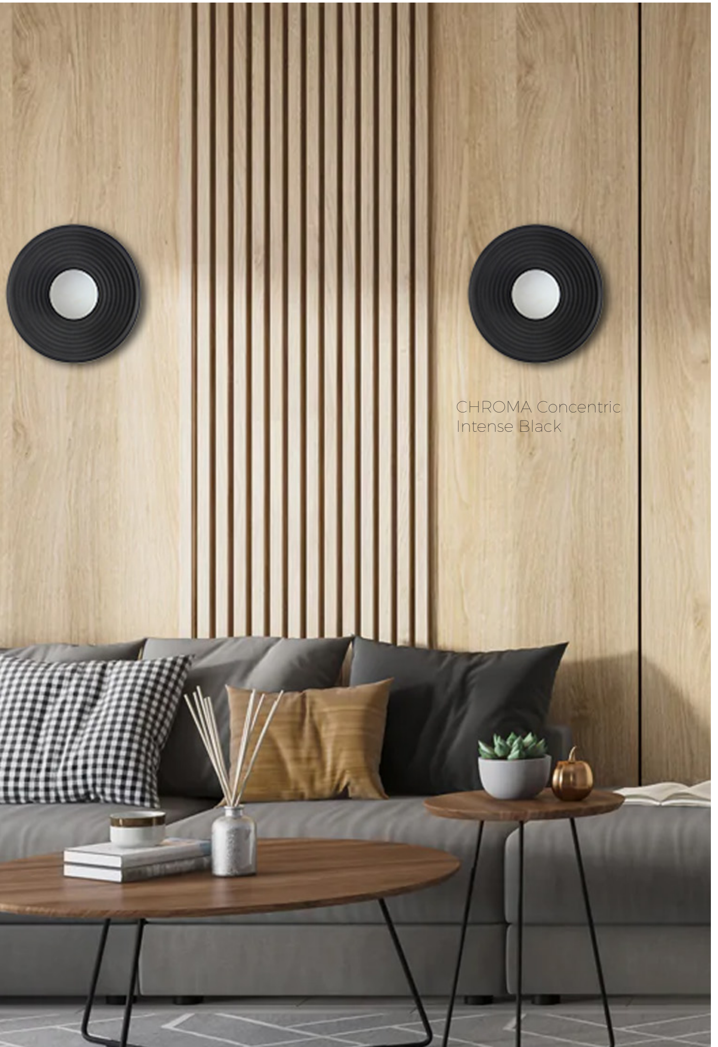
CHROMA Concentric Intense Black