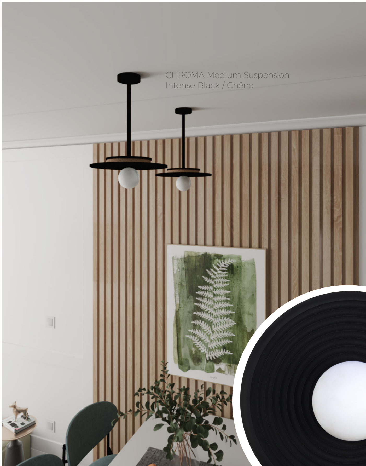
CHROMA Concentric Intense Black