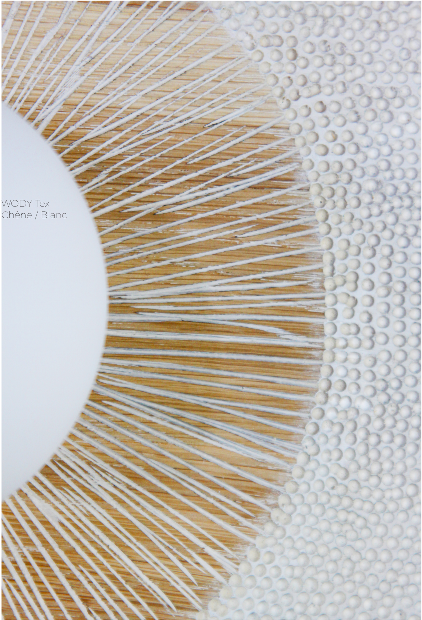
WODY Tex Chêne / Blanc