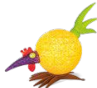
ORANGE | ORANGE 30-57