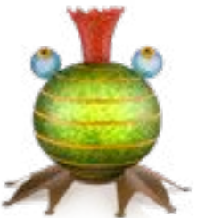
GRÜN | GREEN 31-04