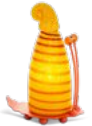
GELB | YELLOW 31-44