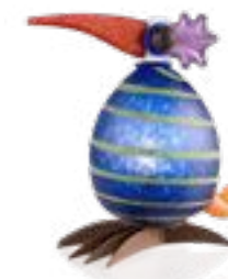
BLAU MIT STREIFEN | BLUE WITH STRIPES 30-13