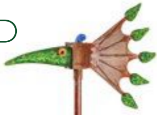
GRÜN | GREEN 34-03

WINDSPIEL WIND CHIME ↓ 170 CM | 67" ↔ 70 CM | 28"