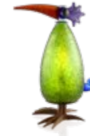
GRÜN | GREEN 30-08