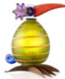
ZITRO MIT STREIFEN | LIME GREEN WITH STRIPES 30-14