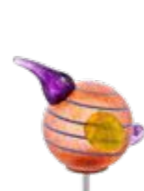
BERNSTEIN | AMBER 02-81