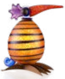
ORANGE MIT STREIFEN | ORANGE WITH STRIPES 30-16