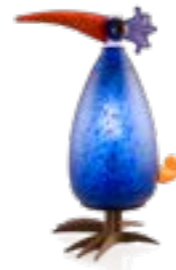
BLAU | BLUE 30-07