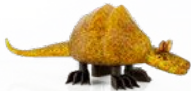
OLIV | OLIVE 30-49