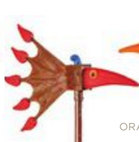
ROT | RED 34-01