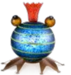
BLAU | BLUE 31-06