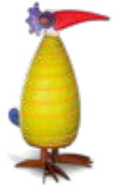
ZITRO MIT STREIFEN | LIME GREEN WITH STRIPES 30-24