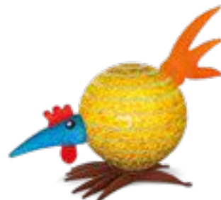
OLIV | OLIVE 30-55