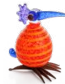
ROT-ORANGE MIT STREIFEN | RED-ORANGE WITH STRIPES 30-18