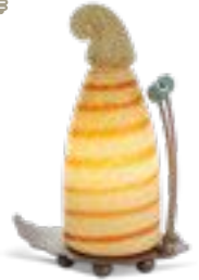
BEIGE | BEIGE 31-45