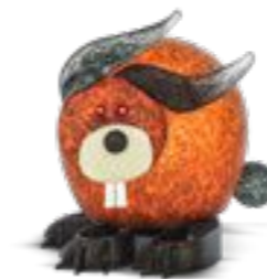
BERNSTEIN | AMBER 30-43