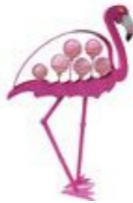
ROSA | ROSE 32-16

AUSSENSKULPTUR OUTDOOR SCULPTURE ↓ 145 CM | 57" ↔ 90 CM | 35"