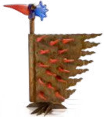
ROT | RED 32-09

AUSSENSKULPTUR OUTDOOR SCULPTURE ↓ 80 CM | 31" ↔ 52 CM | 20"