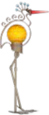
OLIV | OLIVE 30-46