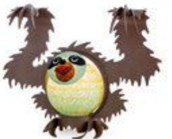
MINTGRÜN | MINT GREEN 30-51