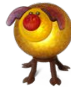
BERNSTEIN | AMBER 31-18