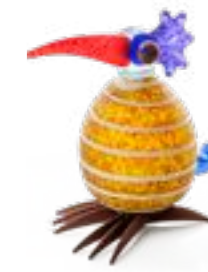
OLIV MIT STREIFEN | OLIVE WITH STRIPES 30-19