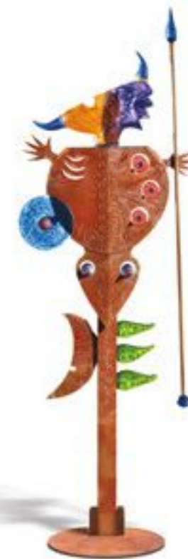
BUNT | MULTICOLORED 42-01