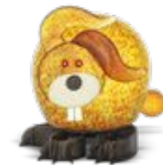
OLIV | OLIVE 30-40