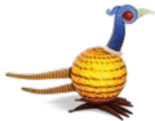
BUNT | MULTICOLORED 30-53