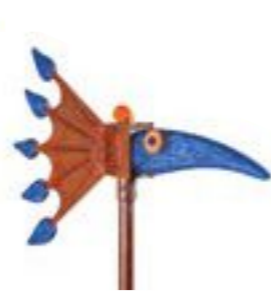
BLAU | BLUE 34-02