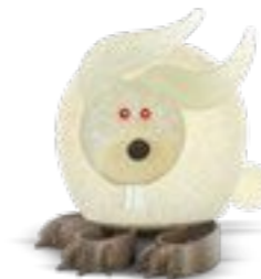
WEISS | WHITE 30-41