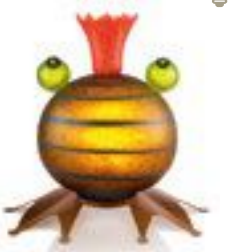
BERNSTEIN | AMBER 31-05