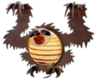
APRIKOSE | APRICOT 30-50