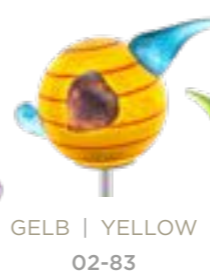
GELB | YELLOW 02-83