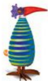
BLAU MIT STREIFEN | BLUE WITH STRIPES 30-26