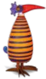
ORANGE MIT STREIFEN | ORANGE WITH STRIPES 30-25