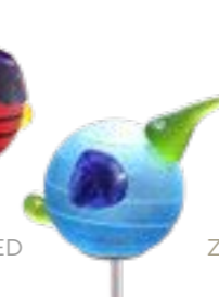
HELLBLAU | LIGHT BLUE 02-82