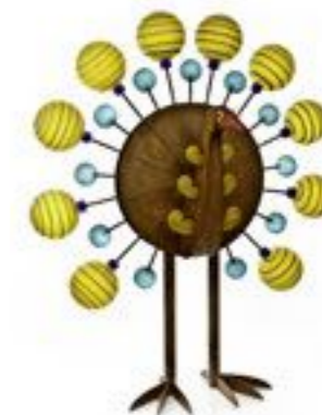
GELB | YELLOW 33-02