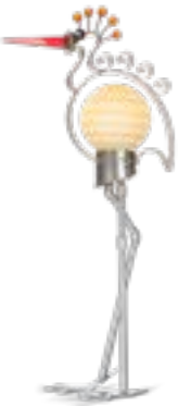
WEISS | WHITE 30-47

AUSSENSKULPTUR OUTDOOR SCULPTURE ↓ 115 CM | 45" ↔ 52 CM | 20"