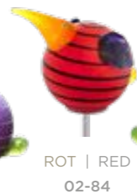
ROT | RED 02-84