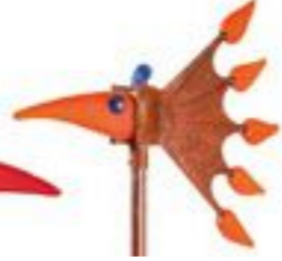
ORANGE | ORANGE 34-04