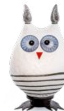
WEISS | WHITE 31-36