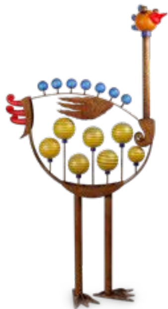
BUNT | MULTICOLORED 32-12