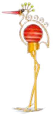
ROT-ORANGE | RED-ORANGE 30-45