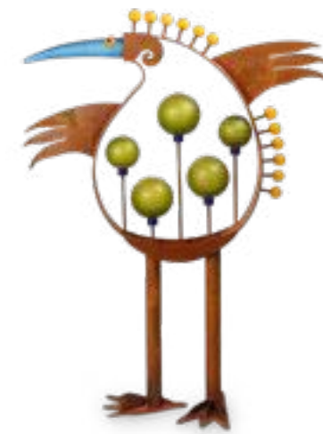
BUNT | MULTICOLORED 32-11