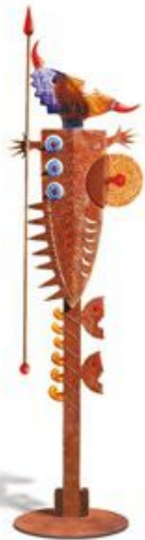
BUNT | MULTICOLORED 42-00