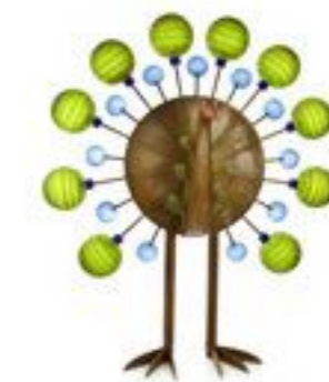
ZITRO | LIME GREEN 33-03