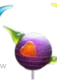
VIOLETT | PURPLE 02-85