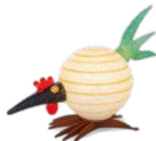
WEISS | WHITE 30-56