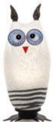
WEISS | WHITE 31-34