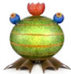
GRÜN | GREEN 31-02