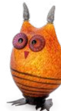
BERNSTEIN | AMBER 31-35