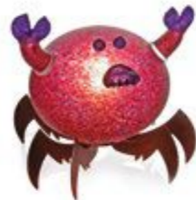
ROT | RED 31-16