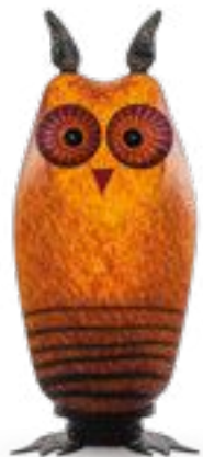
BERNSTEIN | AMBER 31-32