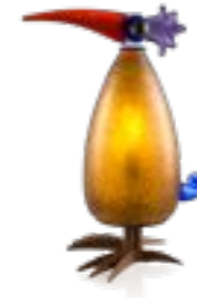
BERNSTEIN | AMBER 30-09