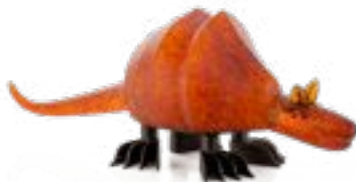
BERNSTEIN | AMBER 30-48