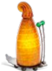
BERNSTEIN | AMBER 31-43