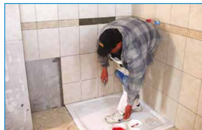
Beltérben Flex G ragasztót használunk a greslapok oldalfalon és aljzaton való elhelyezéséhez is!

Bedolgozhatósági idő: Az anyag a bekeverés befejezésétől kb. ennyi ideig használható fel (átkeverés szükséges lehet)