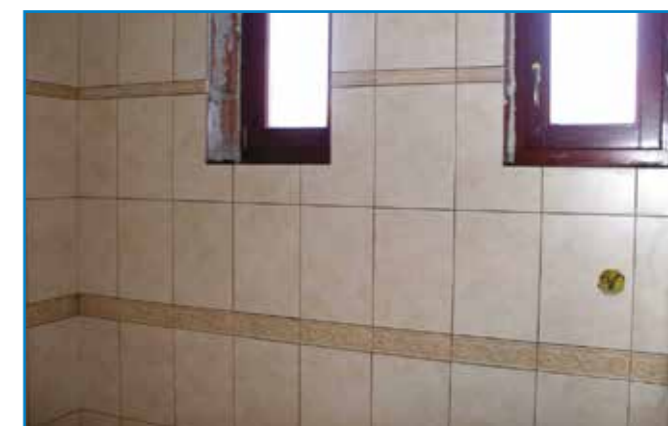
Közepes méretű lapoknál falfűtés esetén is használható a Flex G ragasztó.