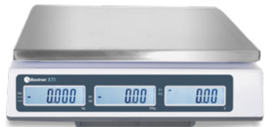
Trois écrans acheteur rétro-éclairés