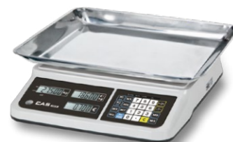
Plateau Pyrex idéal pour les produits en vrac 360 x 280 x 55 mm

La balance PR-II est fabriquée standard avec afficheur arrière. L'utilisateur et le client peuvent voir également le poids et le prix à payer du produit.