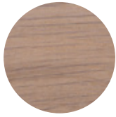
White Oak Rovere Bianco