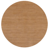
Natural Oak Rovere Naturale