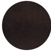
Dark Wengé Ash / Frassino Dark Wengé