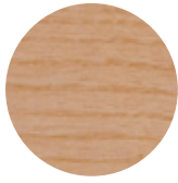
Natural Ash Frassino Naturale