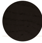
Black Ash Frassino Nero