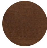
Walnut Ash Frassino Noce