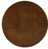
Walnut Oak Rovere Noce