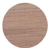
White Oak Rovere Bianco