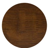
Walnut Oak Rovere Noce