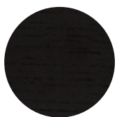
Black Oak Rovere Nero