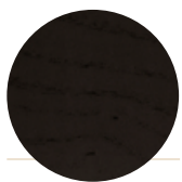
Black Ash Frassino Nero