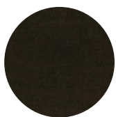
Dark Wengé Oak / Rovere Dark Wengé