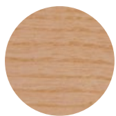
Natural Ash Frassino Naturale