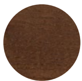
Walnut Ash Frassino Noce