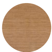
Natural Oak Rovere Naturale