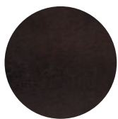
Dark Wengé Ash / Frassino Dark Wengé