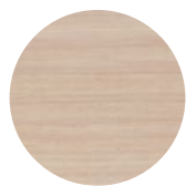
White Ash Frassino Bianco