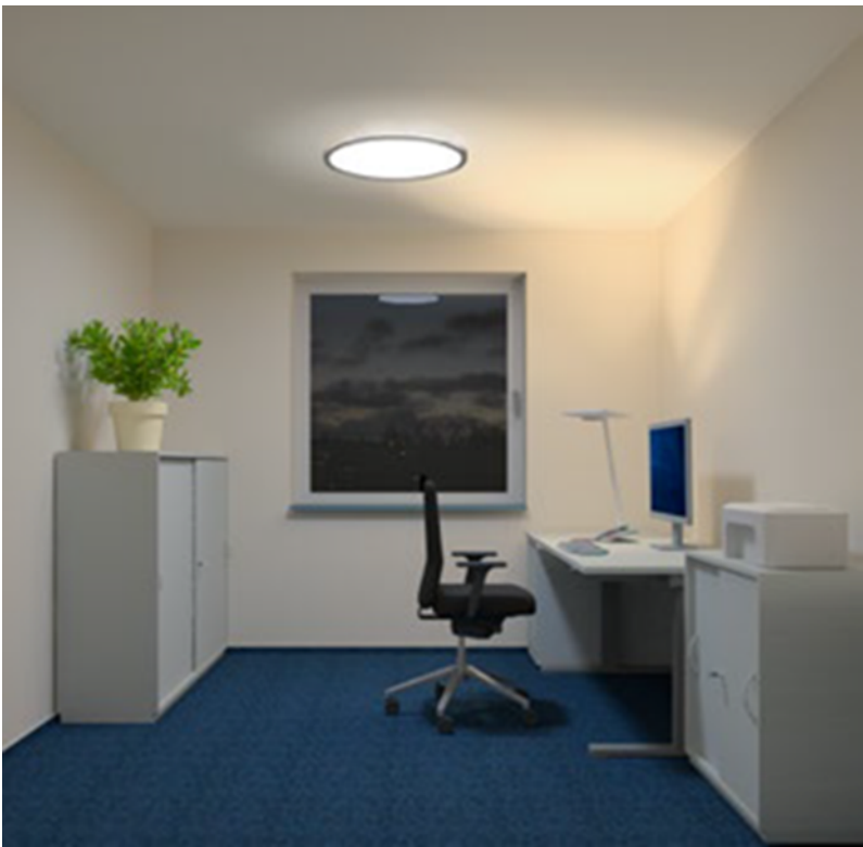
Abbildung 5 – Beispiel für eine Beleuchtungssituation im Homeoffice (aus: DGUV Information 215-442 „Beleuchtung im Büro“)

Die Bildschirmgeräte sollten so aufgestellt werden, dass deren Oberflächen frei von störenden Reflexionen und Blendungen sind. Der Arbeitsplatz soll ausreichend hell sein (500 Lux). Dies kann ergänzend zur häuslichen Beleuchtung zum Beispiel mit einer Stehleuchte oder einer Tischleuchte erreicht werden.