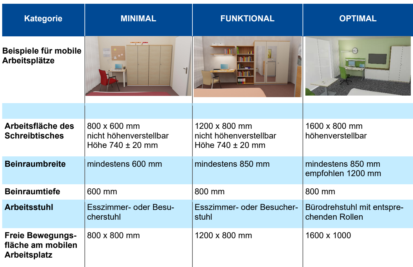
Tabelle 1: Auszug aus FBVW-401 „Mobiles Arbeiten in Hotels“

Die dort beschriebenen Rahmenbedingungen können auch beim Einrichten von mobilen Arbeitsplätzen im privaten bzw. häuslichen Umfeld herangezogen werden. Dabei sind auch beliebige Kombinationen der verschiedenen ergonomischen Empfehlungen möglich. So ist ein Büroarbeitsstuhl vor einer minimalen Tischplatte sicher ergonomisch günstiger als nur der Esszimmerstuhl oder Besucherstuhl. Und auch eine große Tischplatte eines optimalen Schreibtisches ist ergonomisch günstiger als eine Tischplatte der Kategorie FUNKTIONAL, selbst wenn der Tisch nicht höhenverstellbar ist.