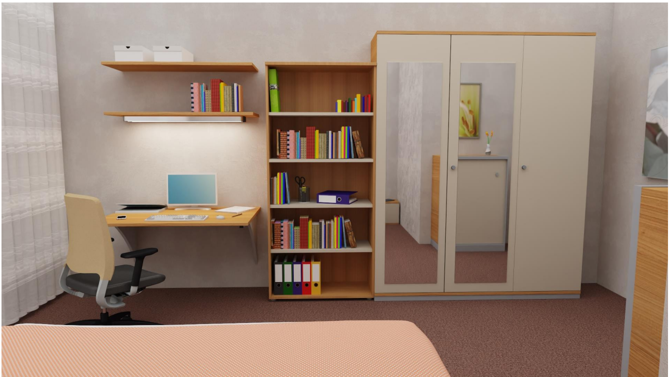
Abbildung 3 – mögliche Einrichtung eines mobilen Arbeitsplatzes – Kategorie FUNKTIONAL als Telearbeitsplatz