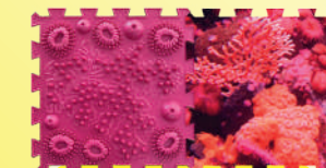
ÉCUEIL DE MER