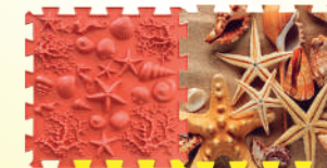
FOND DE MER