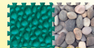
PIERRES DE MER