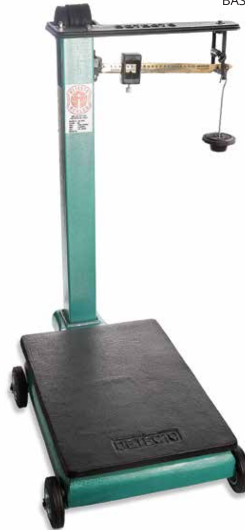
BASCULA DE PLATAFORMA DETECTO BP 25