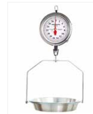
BALANZA MECÁNICA COLGAR 40 LB CC05

*Marca: Detecto Scales *Capacidad: 40 LB / 20 KG *División: 1 ONZA *Mecanismo: Mecánica *Material: Aro en acero inoxidable *Información Extra: Platón de cadenilla con capacidad hasta de 40 lb.