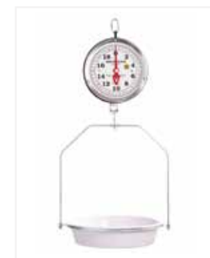
BALANZA MECÁNICA COLGAR 40 LB CC06

*Marca: Detecto Scales *Capacidad: 40 LB / 20 KG *División: 1 ONZA *Mecanismo: Mecánica *Material: Aro en acero Inoxidable *Información Extra: Ponchera de aluminio con capacidad hasta de 40 lb.