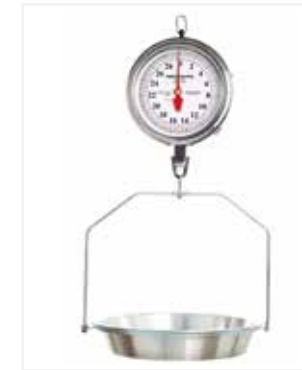
BALANZA MECÁNICA COLGAR 40 LB CE05

*Marca: Detecto Scales *Capacidad: 40 LB / 20 KG *División: 1 ONZA *Mecanismo: Mecánica *Material: Aro Pintado Ponchera Aluminio *Información Extra: Ponchera de aluminio con capacidad hasta de 40 lb.