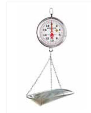
BALANZA MECÁNICA COLGAR 40 LB CE09

*Marca: Detecto Scales *Capacidad: 40 LB / 20 KG *División: 1 ONZA *Mecanismo: Mecánica *Material: Aro Pintado, platon aluminio *Información Extra: Platón de cadenilla con capacidad hasta de 40 lb.