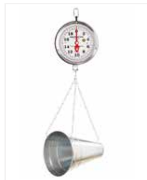
BALANZA MECÁNICA COLGAR 40 LB CE08

*Marca: Detecto Scales *Capacidad: 40 LB / 20 KG *División: 1 ONZA *Mecanismo: Mecánica *Material: Aro Pintado, ponchera pintada *Información Extra: Platón cónico, reloj con aro pintado.