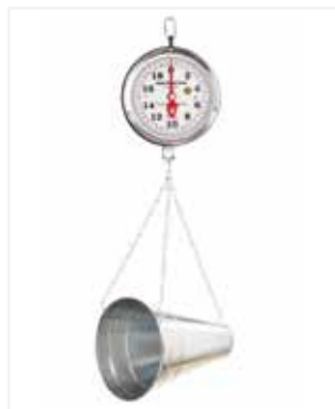
BALANZA MECÁNICA COLGAR 40 LB CC08

Nuestra especialidad es desarrollar la báscula que necesitas