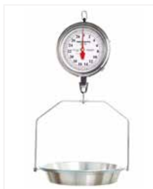
BALANZA MECÁNICA COLGAR 60 LB CE11

*Marca: Detecto Scales *Capacidad: 25 LB / 12.5 KG *División: 1 ONZA *Mecanismo: Mecánica *Material: Aro Pintado, ponchera pintada *Información Extra: Aro de alambre y ponchera.