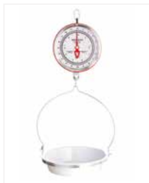
BALANZA MECÁNICA PLATON 25 LB CC07

*Marca: Detecto Scales *Capacidad: 40 LB / 20 KG *División: 1 ONZA *Mecanismo: Mecánica *Material: Aro en acero inoxidable *Información Extra: Platón cónico, reloj con aro acero inoxidable.