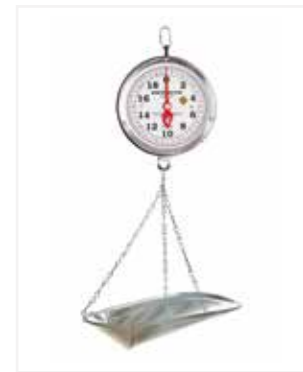
BALANZA MECÁNICA COLGAR 40 LB CC09

*Marca: Detecto Scales *Capacidad: 60 LB / 30 KG *División: 1 ONZA *Mecanismo: Mecánica *Material: Aro en acero Inoxidable *Información Extra: Ponchera de aluminio con capacidad hasta de 60 lb.