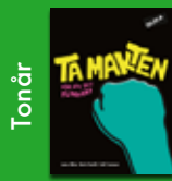
Ta makten – för att det funkar!

Ladda ner BOKHANDLEDNINGAR kostnadsfritt på olika.nu