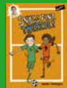
Snygg fint, Therese!