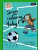
Snygg räddning, Hedvig!