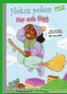
Hokus pokus: Far och flyg