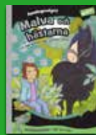
Malva och hästarna