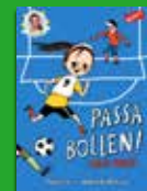
Passa bollen! ropar Kosse