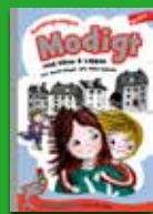
Modigt med Vilma & Loppan