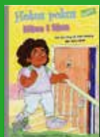
Hokus pokus: Häxa i läxa