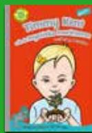
Timmy Kent och de mystiska morötterna